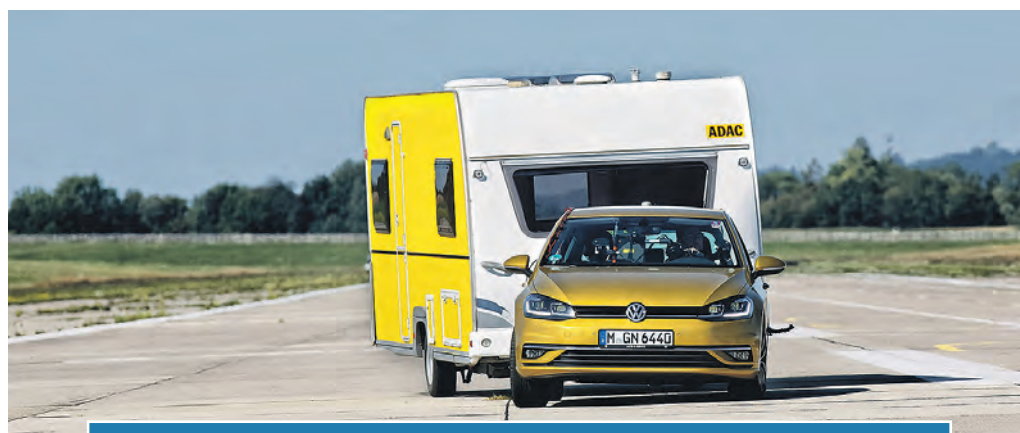
ADAC testet Stabilisierungssysteme für Anhänger

Der ADAC fordert die Hersteller auf, die Gespann-Erkennung im Pkw serienmäßig zu verbauen – unabhängig davon, ob eine Anhängerkupplung ab Werk verbaut ist oder nicht. Außerdem gibt es