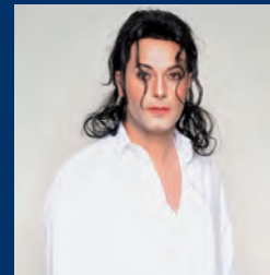
Entertainment Michael Jackson Double