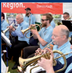
Live Musik Griesheimer Blasmusikverein