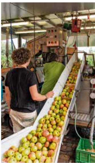
Die mobile Kelterei in Aktion.

Höchst. Am Samstag, 21. September, macht die mobile Obstkelterei vom Frankfurter Lohrberg von 9 – 17 Uhr in Hetschbach an der Rondelhalle Station.