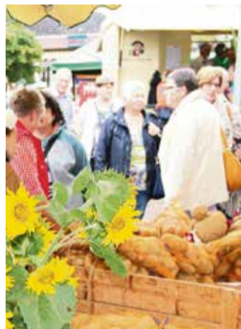
Der Kartoffelmarkt sorgte auch in den vergangenen Jahren für Aufsehen rund um die „tolle Knolle“.

Für die Gäste aus Belotin sucht das Verschwiegerungskomitee Gastfamilien aus Höchst, die von Donnerstag, 19. September, bis Montag, 23. September eine Unterkunft und Frühstück bereitstellen.