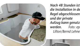
Nach 48 Stunden ist die Installation in der Regel abgeschlossen und der private Aufzug kann genutzt werden.

Elegant barrierefrei wohnen – Ein Homelift benötigt kaum Platz und kann ruck, zuck eingebaut werden (epr) Wird das Treppensteigen mit zunehmendem Alter zum Problem, geht der erste Gedanke meist in Richtung Treppenlift. Eine gute Idee, aber es geht noch besser: mit einem Lifton Homelift! Die clevere Alternative zum Treppenlift lässt sich ebenfalls nachträglich einbauen – ohne viel Schmutz und in der Regel innerhalb von 48 Stunden. Toll: Ein Lifton Homelift ist äußerst platzsparend im Einbau, denn er kommt mit einer Grundfläche von knapp 1 m 2 aus. Benötigt werden lediglich ein Deckenausschnitt und eine Steckdose in der Nähe, eine Baugenehmigung ist nicht erforderlich. Und die Kosten? Sie liegen weit unter dem Preis eines Schachtlifts und können durch Fördermaßnahmen von KfW, Pflegekasse & Co. deutlich gesenkt werden. Mehr unter www.homeplaza.de/lifton .