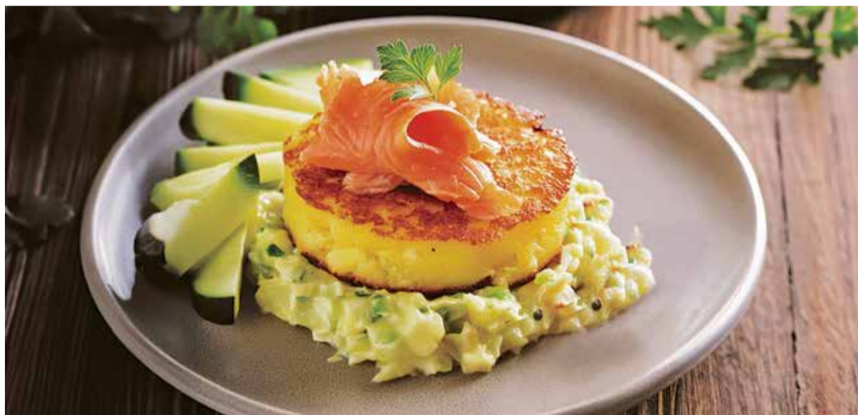
Kartoffelpuffer und Lachs – eine der vielen Kreationen, die die Gaumen der Odenwälder umschmeicheln sollen.

Zwei Wochen steht die Kartoffel im Zentrum des Genusses