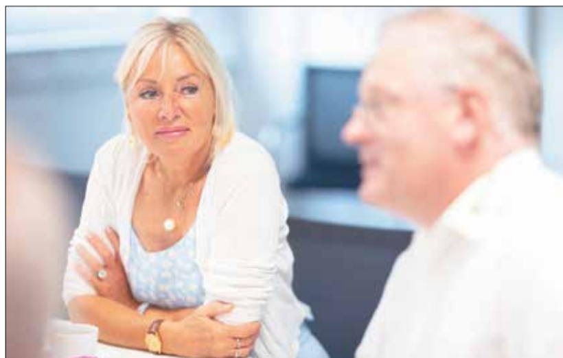
Digitalministerin Sinemus informiert sich über Projekt „Garantiert geliefert“.

Aufgrund kleiner Gütermengen und weiter Wege sind klassische Liefersysteme im ländlichen Raum zumeist nicht rentabel und wenig effizient. Untersuchungen haben gezeigt, dass rund 50 Prozent der gewerblichen Fahrten Leerfahrten sind. Hier setzt das Projekt an: Ladeflächen aller Akteure, die bereits tagtäglich in der Region unterwegs sind, sollen effizienter genutzt werden. Dazu zählen die Fahrzeuge regionaler Produzenten, Händler und Dienstleister sowie die Fahrten von Bussen außerhalb der Hauptverkehrszeiten und viele weitere, bisher ungenutzte Transportkapazitäten. Die neue digitale und durch KI gestützte Logistik-Plattform „Garantiert geliefert“, die im 3. Quartal 2024 an den Start gehen wird, zielt darauf ab, die regionalen Güterverkehr bestehenden Leerfahrten und nicht ausgeschöpften Ladekapazitäten zu erfassen und für Dritte buchbar zu machen. Hierdurch können Transportkosten für „sowieso bestehende Fahrten“ erheblich reduziert und erstmalig Güterverkehre im regionalen Kontext wirtschaftlich darstellbar gemacht werden – sowohl zwischen Unternehmen und Endkunden als auch zwischen Unternehmen und Unternehmen. Künftig soll auch der Öffentliche Personennahverkehr in die Transporte eingebunden werden. Ebenso ist eine