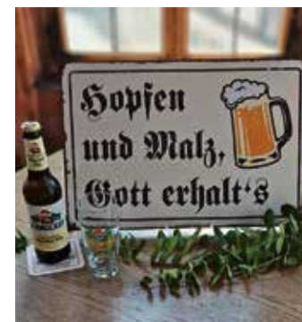
Sinnspruch von Bierbrauern und der Führung durch die Geschichte des Handwerks.

die kühlenden Methoden früherer Zeiten erleben. Die Führung kostet 15 Euro pro Person und richtet sich an Erwachsene ab 18 Jahren. Inklusive sind vier Bierproben und ein Laugengebäck. Die Teilnehmerzahl ist auf maximal 25 Personen begrenzt. Anmeldung über die Gästeinformation Michelstadt, Tel.: 06061-74610, per E-Mail: touristik@michelstadt.de. red