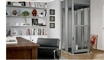
Ein privater Aufzug in den eigenen vier Wänden steigert Wohnkomfort und Lebensqualität – und den Wert der Immobilie.

Das Sonnensegel Flex wird nach individuellen Maßen und Vorlieben hergestellt. Per Online-Konfigurator lassen sich Mastausführung sowie die Größe, Stoff- und Farbvarianten des Tuchs festlegen. Das Segel kann nach Lieferung selbst montiert werden. Auf Wunsch hilft ein Profi vom Soliday Fachhandel.