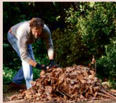
Wer das gesammelte Laub in einer Ecke des Gartens anhäuft, schafft so ein Winterquartier für Igel & Co.

Oberflächenpflege ausgelegt und säubern Holzterrassen, Granit- oder Steinplatten schnell und gründlich. Auch die Gartenmöbel profitieren von einer Reinigung, bevor sie bis zum Frühjahr eingelagert werden. Nach dem letzten Arbeitseinsatz des Jahres wechseln auch die Gartengeräte ins Winterquartier – hier lohnt sich ebenfalls etwas Pflege vorab. Die Geräte sollten gesäubert werden, damit keine Pflanzenreste die Funktion beeinträchtigen. Gelagert werden die Werkzeuge am besten an einem trockenen, gut durchlüfteten Ort wie eine Garage oder ein Gartenhäuschen. Akkus überwintern am besten separat im Haus oder Keller bei Temperaturen über null Grad. Die Winterpause kann zudem genutzt werden, um die Messer von Rasenmäher und Heckenschere nachschärfen oder austauschen zu lassen.