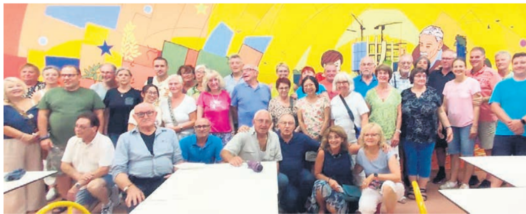
Kürzlich machte sich wieder eine fast dreißigköpfige Gruppe auf den Weg nach Codigoro.

Schon zur Begrüßung waren vielen Mitglieder des dortigen Partnerschaftsvereins an den Stand gekommen um die Gäste mit einem kleinen Mittagsbuffet zu versorgen. Nachdem die Zimmer im Traditionshotel „Club Spiaggia Roma“ am Lido di Nazioni bezogen waren, machte sich die Gruppe wieder auf den Weg nach Codigoro, um bei der Eröffnung der Fiera dabei zu sein. Während ein Teil der Gruppe als Gäste bei der offiziellen Eröffnung teilnahm, traten andere ihren Dienst am Stand des Partnerschaftsvereins an, um die Freunde, wie an allen weiteren Tagen, ein wenig bei der Getränkeausgabe und dem Bedienen zu