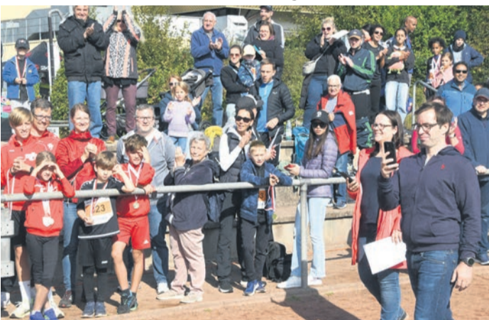
Im Start- und Zielbereich ballten sich beim „4. Eppertshäuser Storchenlauf“ die Zuschauer.

Eppertshausen (EA) Beim 4. Storchenlauf des TAV Eppertshausen am letzten Sonntag motivierte eine vorauslaufende Störchin die Babinis auf ihrer Stadionrunde im Eppertshäuser Sportzentrum zu Bestleistungen. Das Orgateam Crosslauf bedankt sich bei allen Helferinnen und Helfern, für die leckeren Kuchenspenden sowie bei den Sponsoren und Spendern für ihre großzügige finanzielle Unterstützung. Der Vorstand gratuliert dem Orgateam zum 4. erfolgreichen Crosslauf-Event und der sehr guten Resonanz der Teilnehmer, Eltern und Zuschauer.