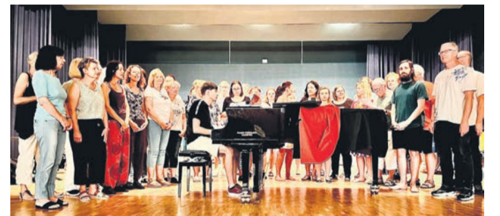
„Da Capo“ hat sich mit viel Spaß und Motivation mit dem Programm und den Liedern für die „Zeitreise 2025“ intensiv befasst.

10 – 12 Uhr und Montag- und Donnerstagnachmittag von 16 – 18 Uhr.