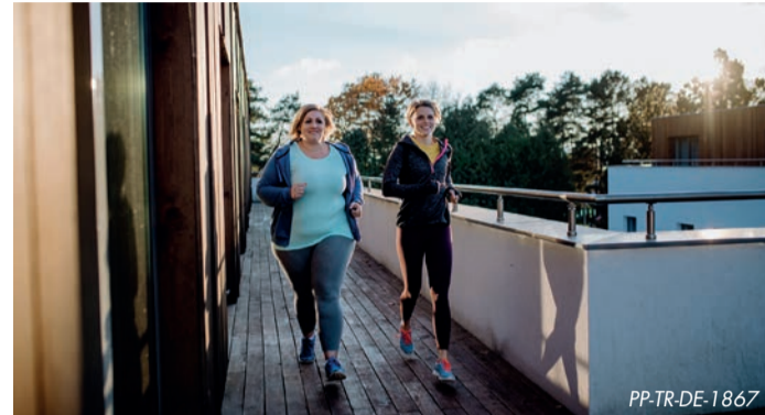
Zum Abnehmen reichen gesunde Ernährung und Bewegung allein oft nicht aus.

wechsls wichtig. Sie bewirken die Ausschüttung von Insulin und Glukagon und steuern außerdem das Sättigungsgefühl. Zudem haben sie Einfluss auf die Speicherung von Zuckern und Fetten aus der Nahrung – und regeln das Gleichgewicht von Kalorienzufuhr