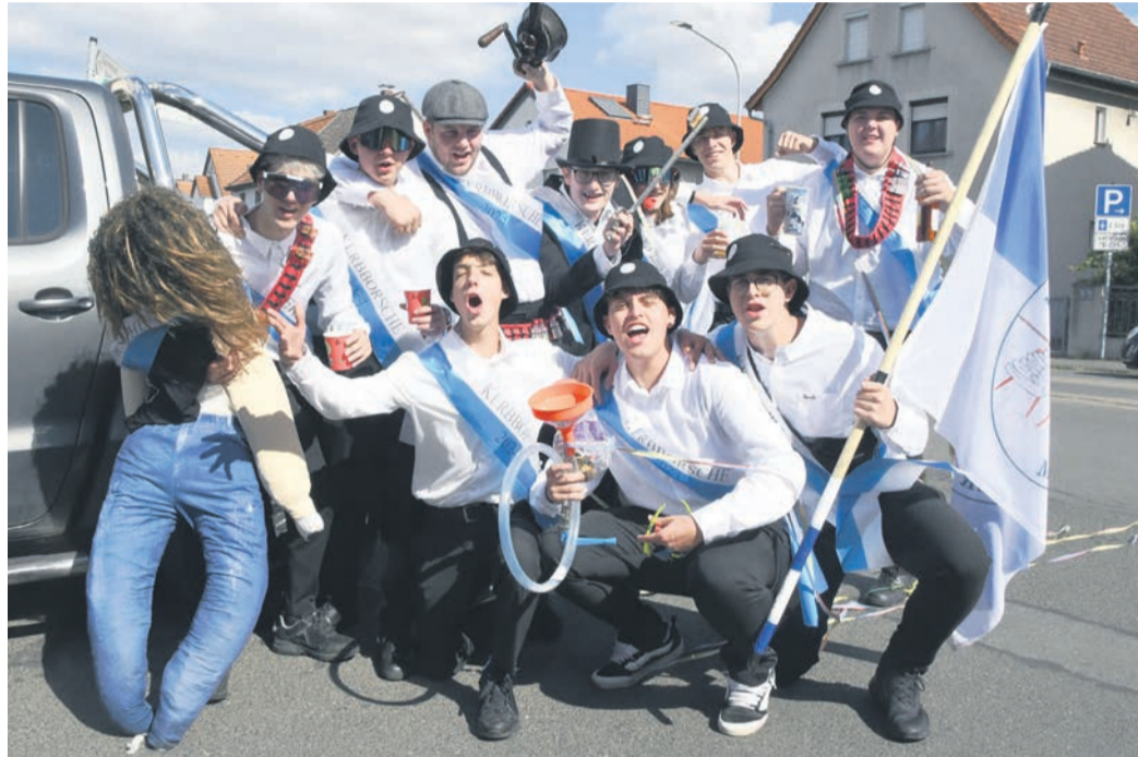
Gruppenbild mit Puppe: die Münsterer Kerbburschen 2024.