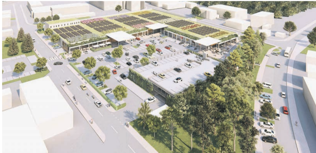
So könnten die Handelsflächen an der Industriestraße aus der Vogelperspektive aussehen. (Foto: Vorentwurf, Graf Architektur)

Die REWE-Group plant auf ihrem Gelände an der Industriestraße eine Modernisierung ihres Centers. Die vorhandene Tankstelle und die Waschanlage sollen einem Anbau für eine weitere Verkaufsfläche weichen. Das Bestandsgebäude soll umgebaut und mit einer Photovoltaik-Anlage sowie Grünflächen ergänzt werden. Insgesamt sollen nach dem Umbau drei Märkte auf dem Grundstück entstehen: Der