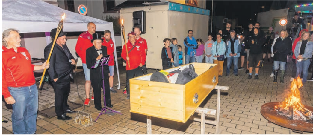
Der Kerbborsch wird zu Grabe getragen.

Am Samstag startete die Kerb mit einem Festzug vom Feuerwehrhaus zum Dorfplatz. Dabei wurde der Kerbbaum mit dem Kerbborschen von den Alten Herren der Fußballabteilung des TVR zum Dorfplatz getragen und dort aufgestellt. Mit dabei waren auch Kindern aus den Fußball- und Turnabteilungen des TVR und der Kinderfeuerwehr Rembrücken sowie den Tenniskids. Fast pünktlich um 16 Uhr wurde die Kerb mit dem traditionellen Fassbieranstich von Bürgermeister Steffen Ball eröffnet. Der Bürgermeister hatte kurz zuvor mit vollem Körpereinsatz das Fass angestochen und die Menge war begeistert, als das kühle Nass endlich floss. Zwar war nicht an allen Tagen eitler Sonnenschein, aber trotzdem war die Kerb gut besucht. Mit einem feierlichen Abschied