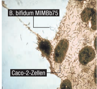
Gut erkennbar: B. bifidum MIMBb75 legt sich an Darmepithelzellen an. 3

Heute nehmen Wissenschaftler an, dass eine der häufigsten Ursachen von wiederkehrenden Darmbeschwerden eine geschädigte Darmbarriere ist – bereits durch kleinste Schädigungen (sogenannte Mikroläsionen) können Erreger und Schadstoffe in die Darmwand eindringen, den Darm reizen und Entzündungen hervorrufen. Die unangenehmen Folgen: Immer wieder Darmbeschwerden wie Durchfall, Bauchschmerzen, Blähungen und Verstopfung. 2 Diese können einzeln oder in Kombination auftreten und auch in Intensität und Dauer variieren. Für Betroffene stellt dies eine