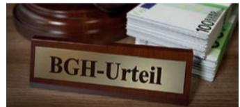
Es geht um viel Geld

rungsverträge auch heute noch anfechtbar. Man nennt dies „ewiges Widerrufsrecht“. Bei einem Widerruf erhalten Sie – anders als bei der Kündigung – alle eingezahlten Beiträge ohne Abzug von Maklerprovisionen und Verwaltungskosten zurück. Und nicht nur das: die Versicherung muss Sie auch an dem mit Ihrem Geld erzielten Anlagegewinn beteiligen. So können Sie bis zu 150% der eingezahlten Beiträge zurückholen. Ein sattes Plus auf Ihrem Konto winkt!