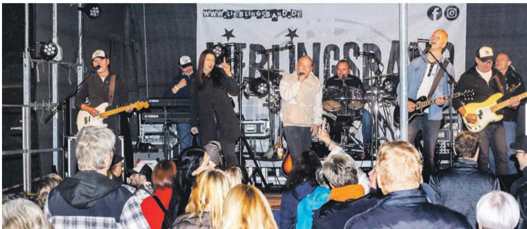
Den Musikern der „Lieblingsband“ merkte man den Spaß an.

Open-Air-Konzert beendete den Kultursommer