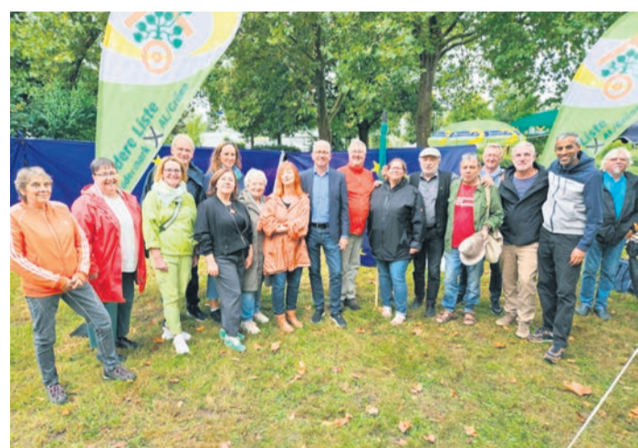
AL Picknick im Park mit Appell von Tarek Al-Wazir

markungsgebiet abgearbeitet werden. Dann könnten sämtliche Sperrungen und Umleitungen aufgehoben werden. Mit einer Tragdeckschicht, die im Anschluss an die Leerrohrverlegung aufgezogen werde, sei nach dem Ende der Arbeiten wieder guter Wegekomfort für Radler, Fußgänger und landwirtschaftlichen Verkehr gewährleistet.