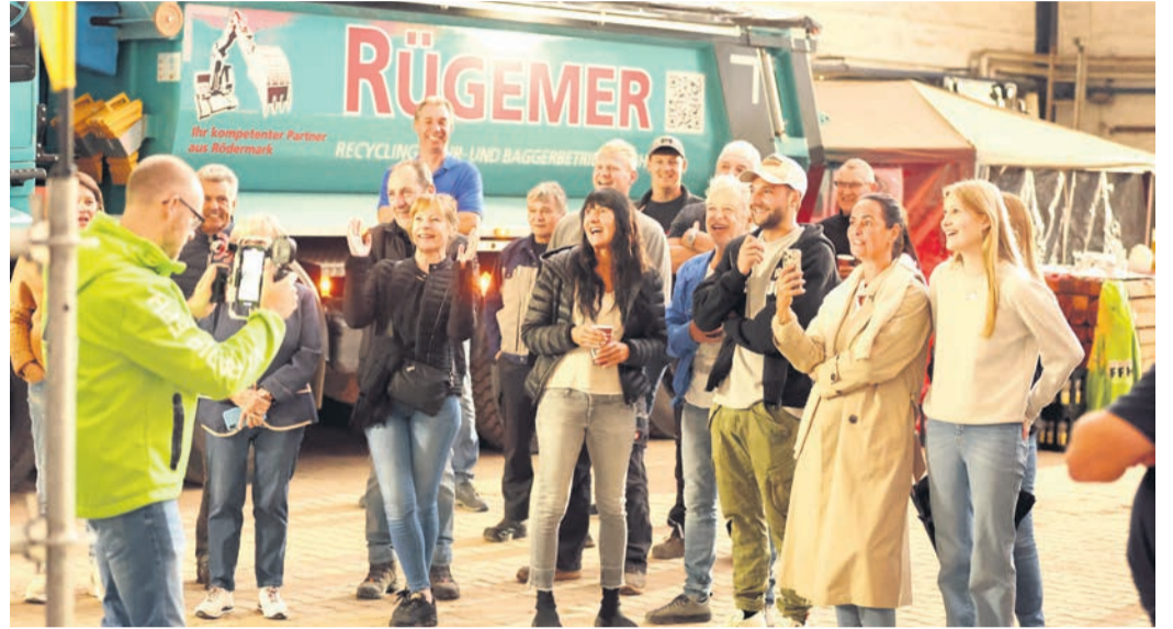
Die Belegschaft hatte beim „Cheffe versenken“ viel Spaß.