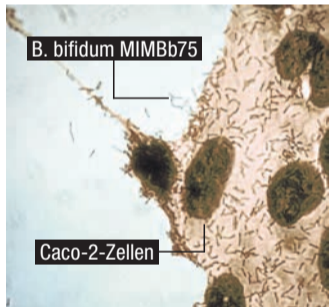
Gut erkennbar: B. bifidum MIMBb75 legt sich an Darmepithelzellen an. 3

Heute nehmen Wissenschaftler an, dass eine der häufigsten Ursachen von wiederkehrenden Darmbeschwerden eine geschädigte Darmbarriere ist – bereits durch kleinste Schädigungen (sogenannte Mikroläsionen) können Erreger und Schadstoffe in die Darmwand eindringen, den Darm reizen und Entzündungen hervorrufen. Die unangenehmen Folgen: Immer wieder Darmbeschwerden wie Durchfall, Bauchschmerzen, Blähungen und Verstopfung. 2 Diese können einzeln oder in Kombination auftreten und auch in Intensität und Dauer variieren. Für Betroffene stellt dies eine