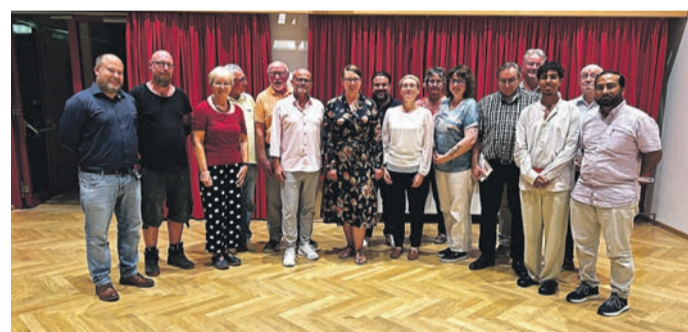
Der neu gewählte Vorstand.

Diskussion über die Stationierung von US-Raketen in Deutschland