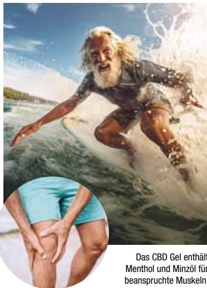
Das CBD Gel enthält Menthol und Minzöl für beanspruchte Muskeln.

Der älteste Hanf-Fund in Europa liegt in Deutschland und wird auf 5500 v. Chr. datiert. Damals war jedoch noch nicht zu erahnen, dass insbesondere der Cannabisstoff CBD einmal einen Siegeszug in der Wissenschaft antreten würde. Heute ist ein regelrechter CBD-Boom ausgebrochen. Kein Wunder, denn anders als der ebenfalls bekannte Cannabisstoff THC (Tetrahydrocannabinol), der für die berauschende Wirkung der Cannabisdroge verantwortlich ist, macht CBD weder „high“ noch abhängig. Sogar die WHO (Weltgesundheitsorganisation) stuft CBD als sichere Substanz mit einem geringen Risiko ein. 1 Zahlreiche Studiendaten deu-