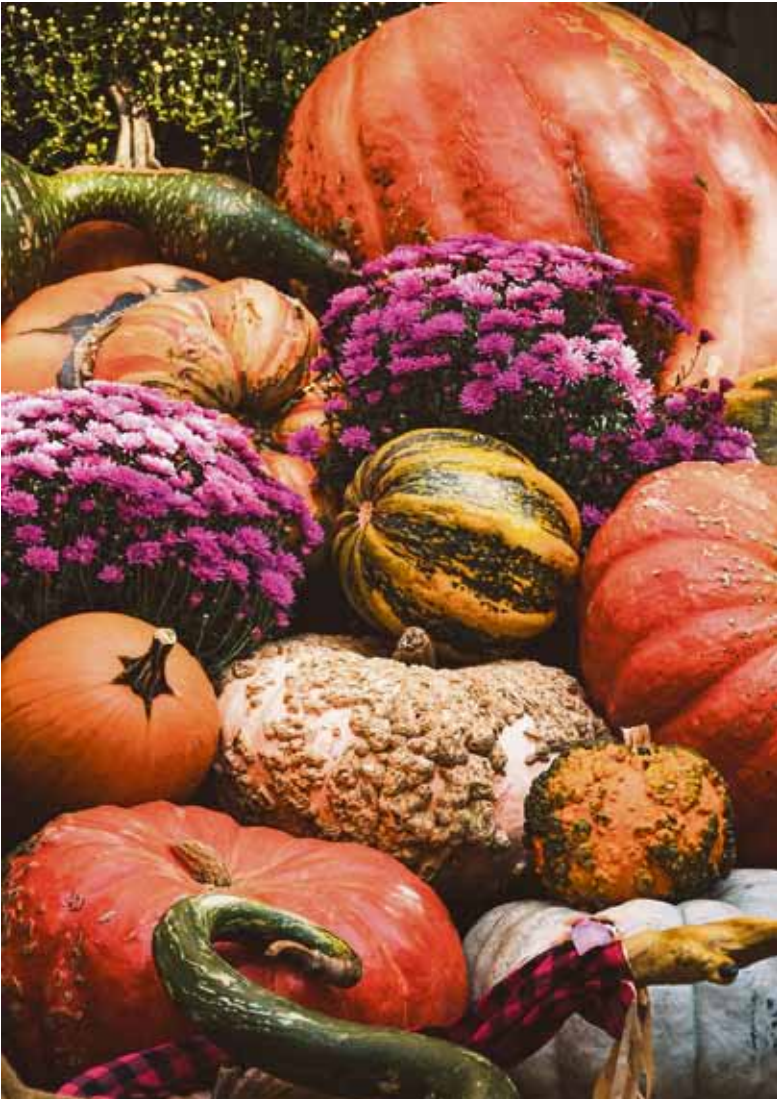
Es gibt viele verschiedene Arten