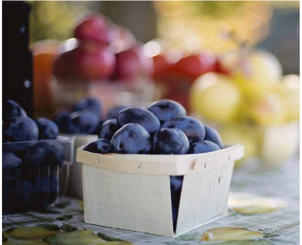
Eine ausreichende Vitaminzufuhr ist gut für die Gesundheit.

Ausgewogen bedeutet gesund und gesund bezieht sich nicht nur auf die Lebensmittelauswahl. Es geht auch darum, wie du dich ernährst. Zum einen sind Verbote nie die Lösung. Stattdessen sollte man versuchen eine gesunde Beziehung zum Essen aufzubauen. Bewusstes essen und genießen sollte im Vordergrund stehen. Deshalb sollte man sich Zeit für seine Mahlzeiten nehmen und langsam und bewusst essen. Das verhindert auch, dass man sich überisst, da erst zehn bis 15 Minuten nach Beginn der Mahlzeit das Sättigungsgefühl einsetzt. Auch zum Kauen sollte man sich