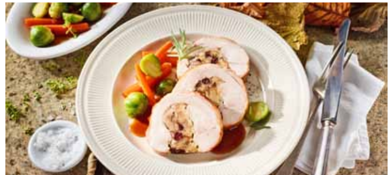
Leckerer Rezepttipp zum Schlemmen an Thanksgiving: Putenunterkeulen-Rollbraten mit Maisbrot-Cranberryfüllung, Rosenkohl und Möhren.

ölte Alufolie legen, Maisbrotmasse darauf geben, aufrollen und im Ofen etwa 60 bis 75 Minuten bei 180 Grad garen. Für die Soße Mehl in 2 EL Butter rühren, mit Geflügelbrühe und Worcester-Soße köcheln lassen, bis sie andickt und mit Salz und Pfeffer würzen. Putenunterkeulen-Rollbraten aufschneiden und auf der Soße anrichten. Dazu passen Rosenkohl, Erbsen und Möhren.