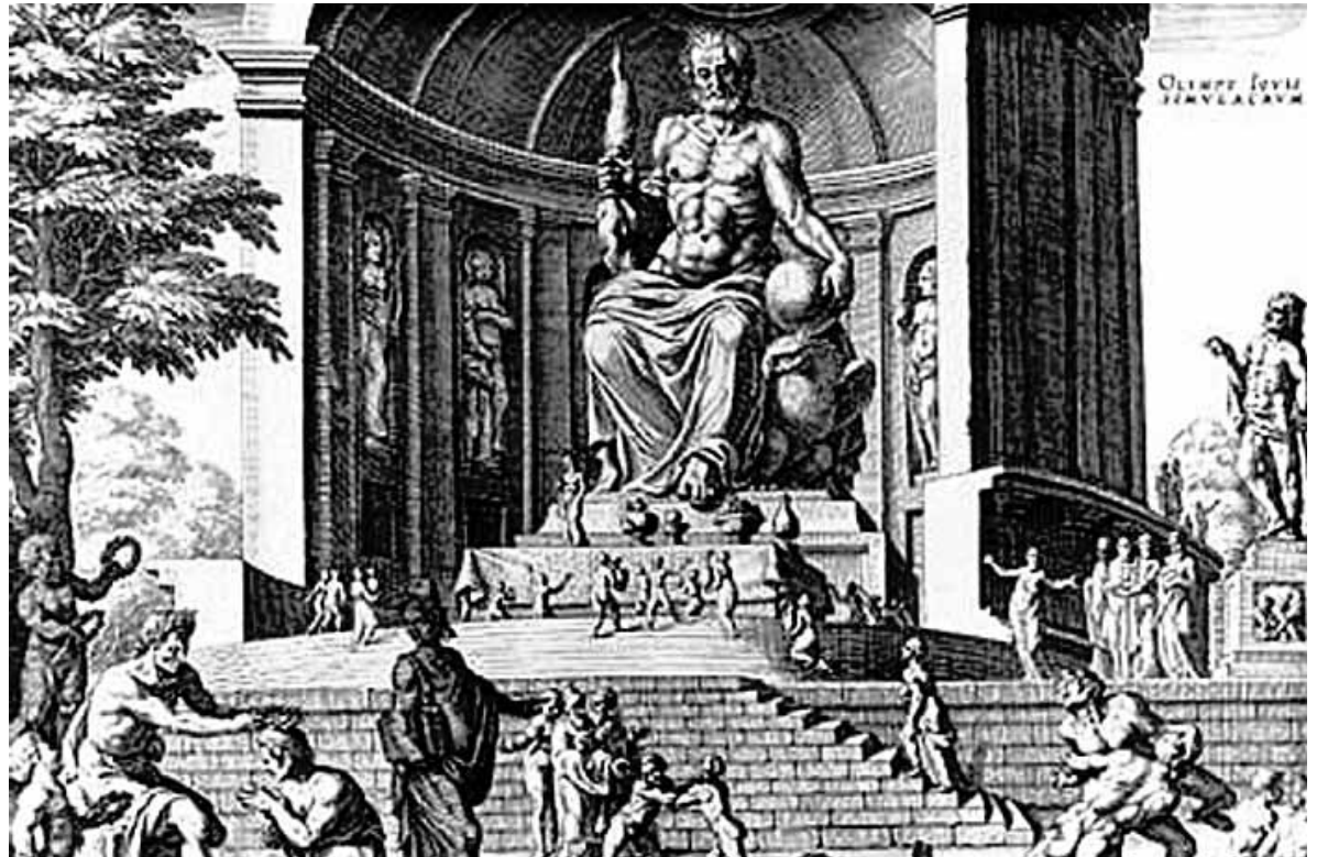
Statue des Zeus.