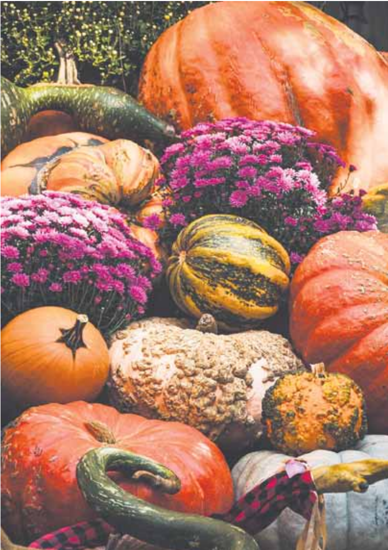
Es gibt viele verschiedene Arten