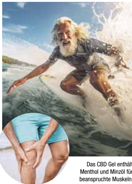
Das CBD Gel enthält Menthol und Minzöl für beanspruchte Muskeln.

Der älteste Hanf-Fund in Europa liegt in Deutschland und wird auf 5500 v. Chr. datiert. Damals war jedoch noch nicht zu erahnen, dass insbesondere der Cannabisstoff CBD einmal einen Siegeszug in der Wissenschaft antreten würde. Heute ist ein regelrechter CBD-Boom ausgebrochen. Kein Wunder, denn anders als der ebenfalls bekannte Cannabisstoff THC (Tetrahydrocannabinol), der für die berauschende Wirkung der Cannabisdroge verantwortlich ist, macht CBD weder „high“ noch abhängig. Sogar die WHO (Weltgesundheitsorganisation) stuft CBD als sichere Substanz mit einem geringen Risiko ein. 1 Zahlreiche Studiendaten deu-