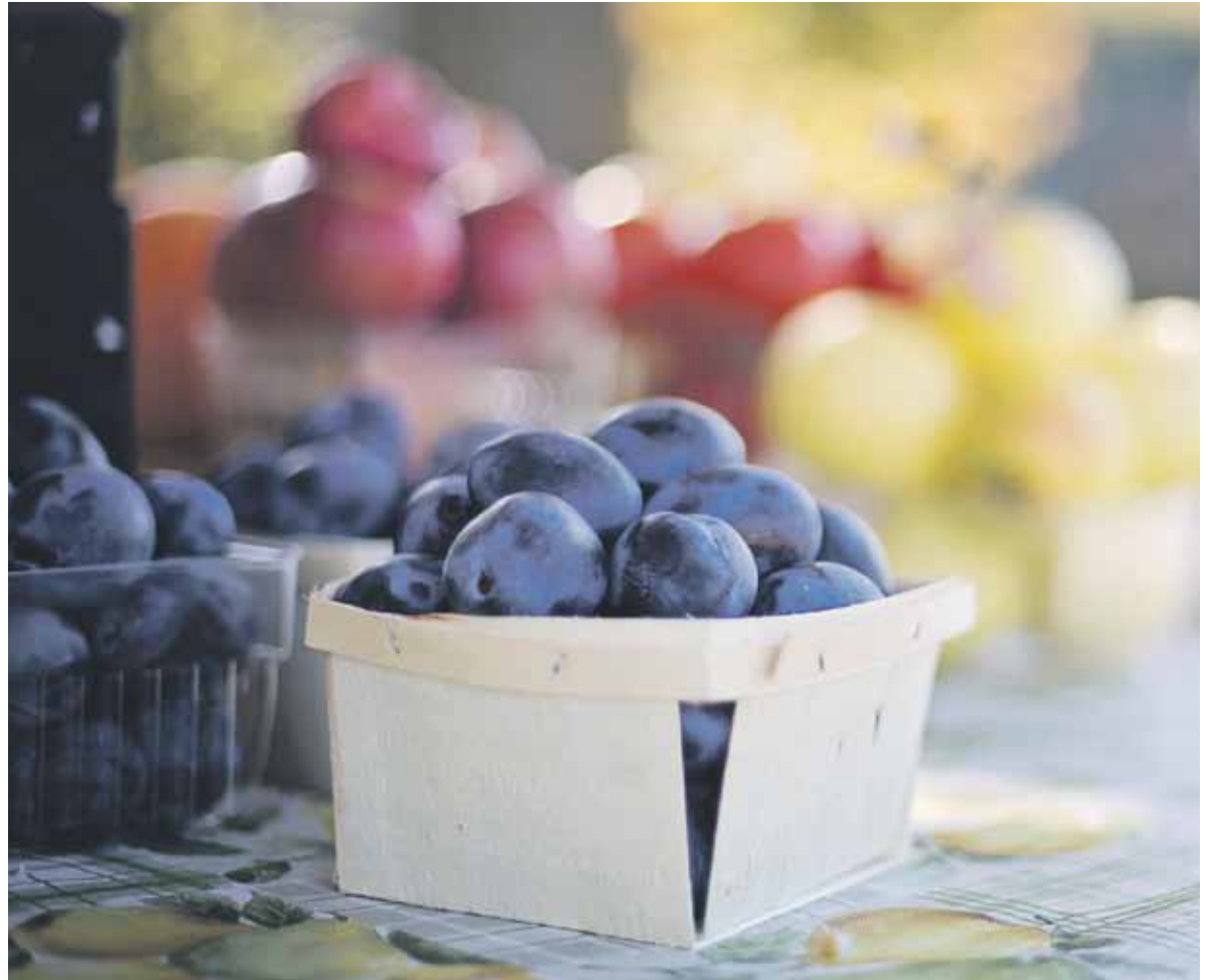
Eine ausreichende Vitaminzufuhr ist gut für die Gesundheit.

Ausgewogen bedeutet gesund und gesund bezieht sich nicht nur auf die Lebensmittelauswahl. Es geht auch darum, wie du dich ernährst. Zum einen sind Verbote nie die Lösung. Stattdessen sollte man versuchen eine gesunde Beziehung zum Essen aufzubauen. Bewusstes essen und genießen sollte im Vordergrund stehen. Deshalb sollte man sich Zeit für seine Mahlzeiten nehmen und langsam und bewusst essen. Das verhindert auch, dass man sich überisst, da erst zehn bis 15 Minuten nach Beginn der Mahlzeit das Sättigungsgefühl einsetzt. Auch zum Kauen sollte man sich