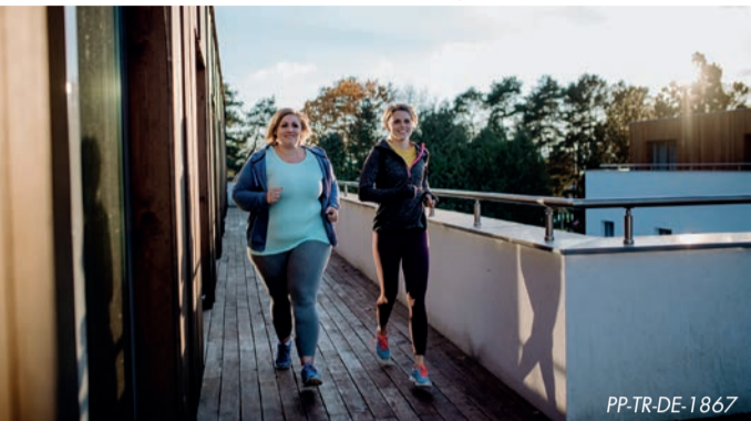
Zum Abnehmen reichen gesunde Ernährung und Bewegung allein oft nicht aus.

wechslers wichtig. Sie bewirken die Ausschüttung von Insulin und Glukagon und steuern außerdem das Sättigungsgefühl. Zudem haben sie Einfluss auf die Speicherung von Zuckern und Fetten aus der Nahrung – und regeln das Gleichgewicht von Kalorienzufuhr