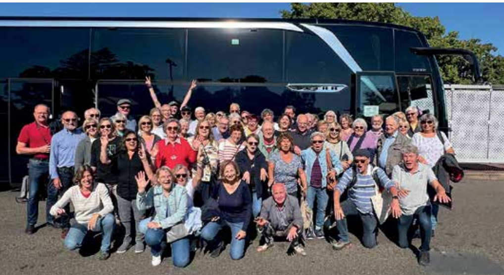
Beste Stimmung bei der Bürgerfahrt.

Bürgerfahrt nach Verneuil-sur-Seine, Paris und Rouen