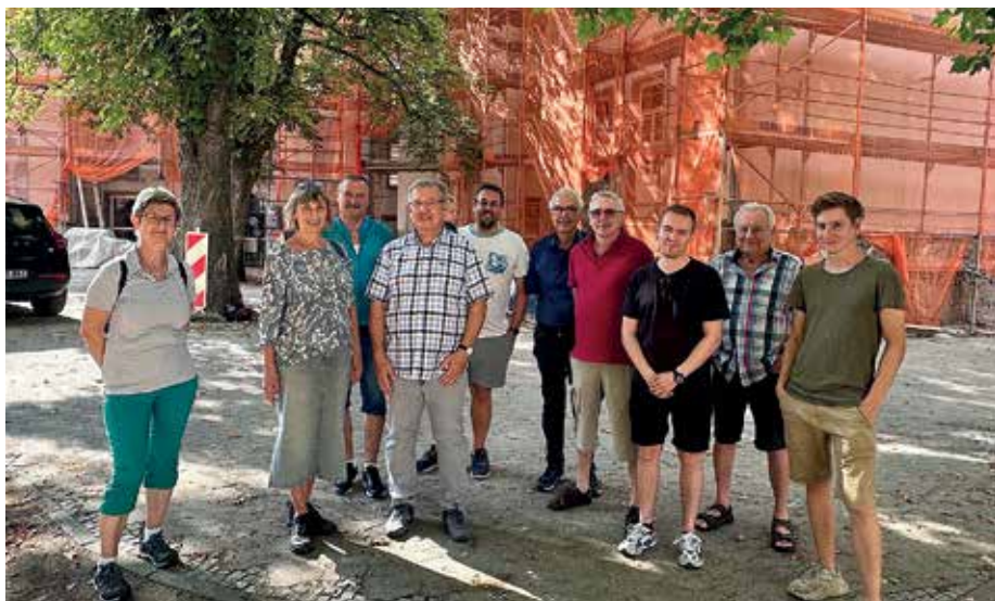
Die SPD-Fraktion vor der Baustelle.