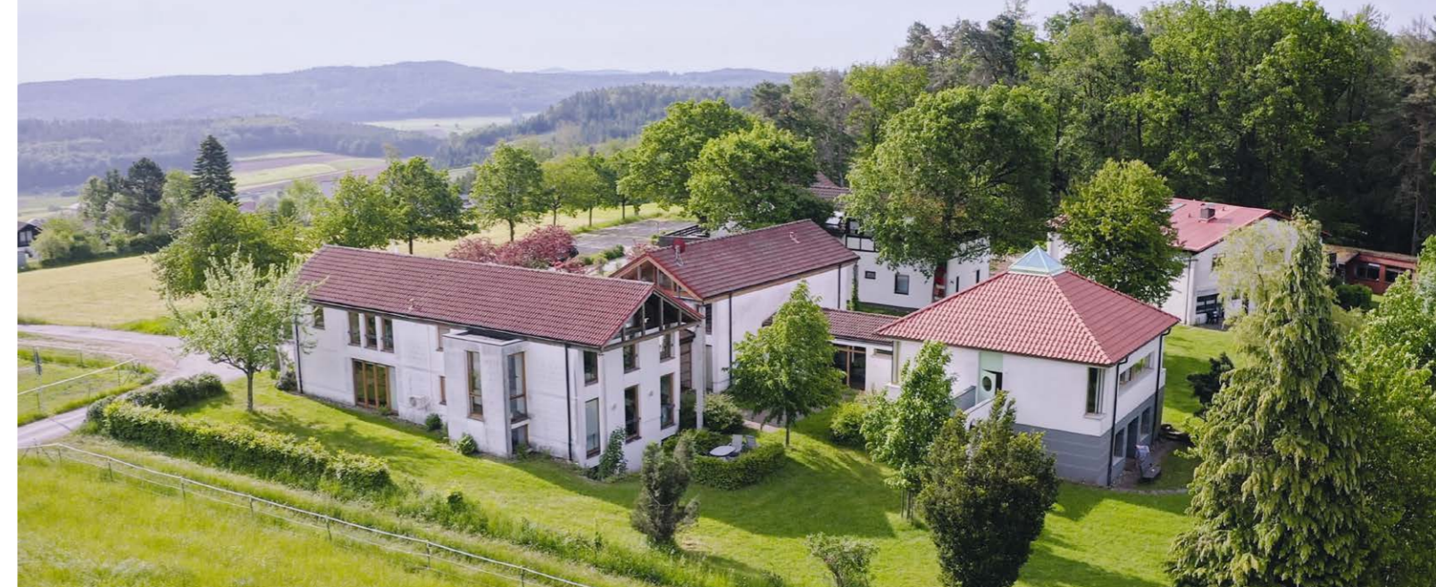
Das Video „Flug über die Tromm – Das Odenwald-Institut von oben“ auf der Website des Instituts ermöglicht, die Seminarhäuser aus neuer Perspektive kennenzulernen.