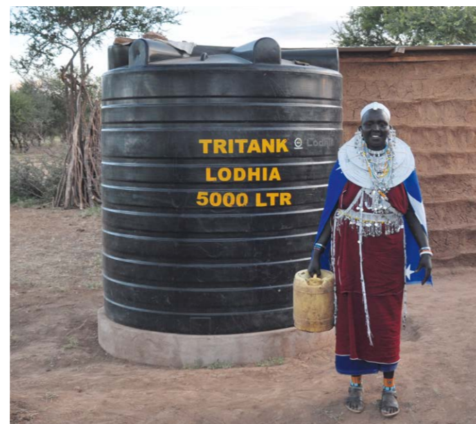
Dank des Wassertanks muss Nemerika nicht mehr stundenlang zur Wasserstelle laufen.

Insgesamt profitieren direkt 1.550 Menschen von dem dreijährigen Projekt, weitere 5.000 indirekt.