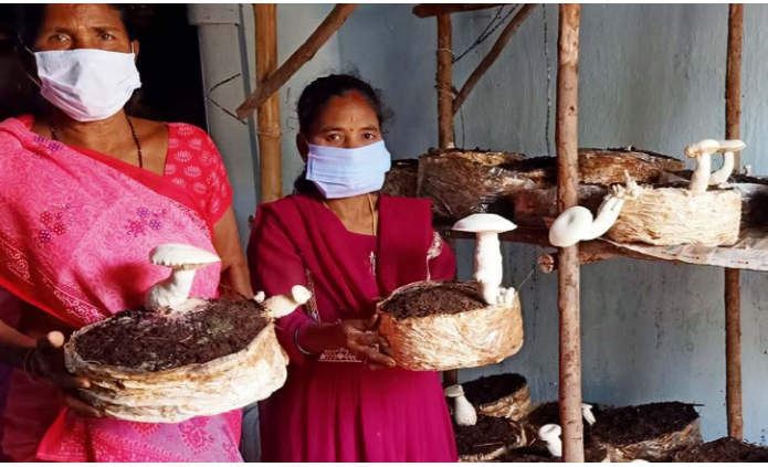
750 Kg Pilze konnten die Frauen in nur einem Jahr ernten.