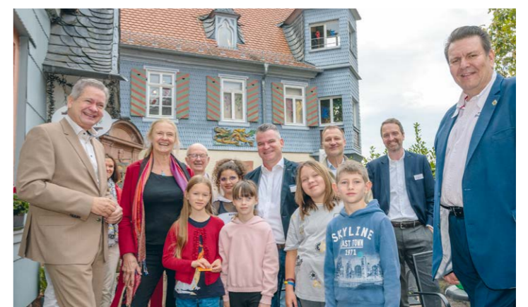
Vor der Preisverleihung besuchte Cornelia Funke das Drachendomuseum in Lindenfels.

Nach dem Museumsrundgang ging es noch in die Lindenfels Carl-Orff-Schule. Dort las sie den Kindern der dritten und vierten Klasse aus ihrem Buch Drachenreiter vor und nahm sich viel Zeit für die Fragen der Schüler*innen. Ein Kind wollte z.B. wissen, ob sie auch mal Schreiburlaub nehme. Funke antwortete schmunzelnd: „Nimmst du Urlaub von Schokolade? Nein, ich muss jeden Tag schreiben und zeichnen.“ Als Überraschung erhielten die Mädchen und Jungen personalisierte Lesezeichen, die die Autorin bereits zu Hause in Italien mit Namen versehen und signiert hatte. Auch die Kinder hatten für ihren Gast ein Geschenk: Einen selbst produzierten Stop-Motion-Film über die Nibelungensage.