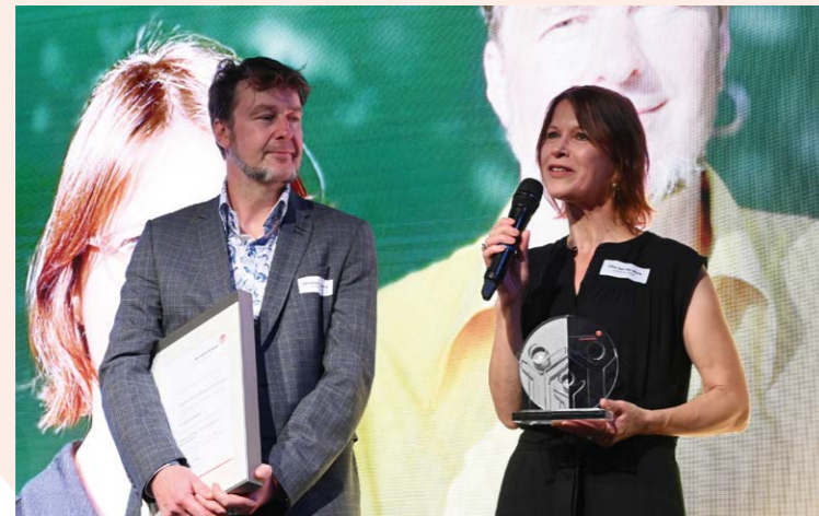
Durchstarten mit Down-Syndrom, darum geht es in der TV-Dokumentation „Marie will alles“ von Christoph Goldbeck und Ilka aus der Mark.