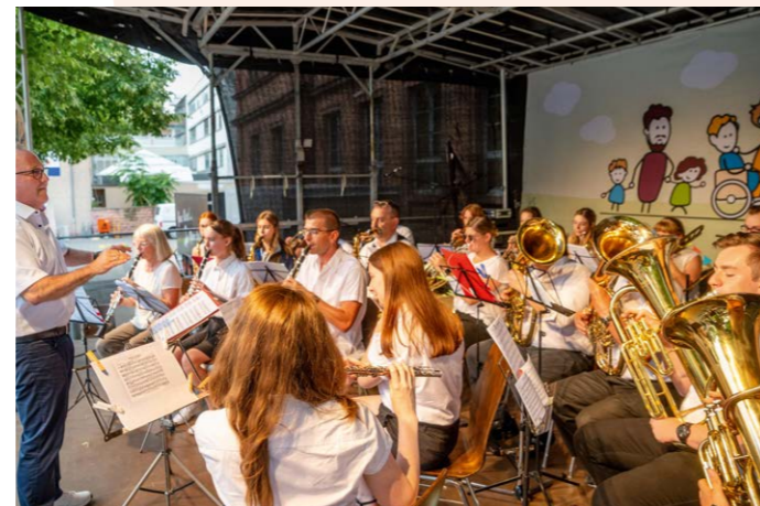
Der Posaunenchor Hofheim spielte auf der Bühne im Stadtpark.

Ausgerichtet wurde der Familientag von unserer Stiftung und dem Hessischen Ministerium für Soziales und Integration in Kooperation mit der Stadt Lampertheim als Gastgeber.