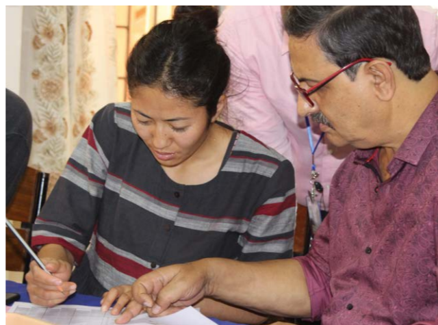
In den Workshops wird intensiv in Gruppen gearbeitet.