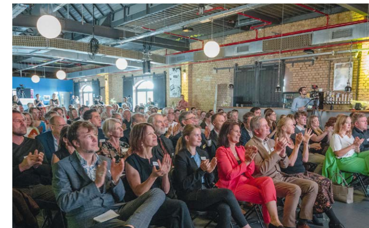
Rund 140 Gäste nahmen an der Preisverleihung teil.