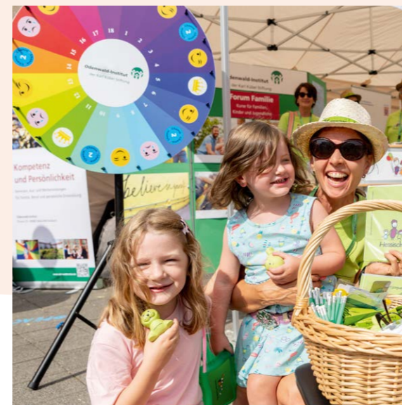
Das Glücksrad am Stand des Odenwald-Instituts war ein Publikumsmagnet und sorgte für viele strahlende Gesichter.