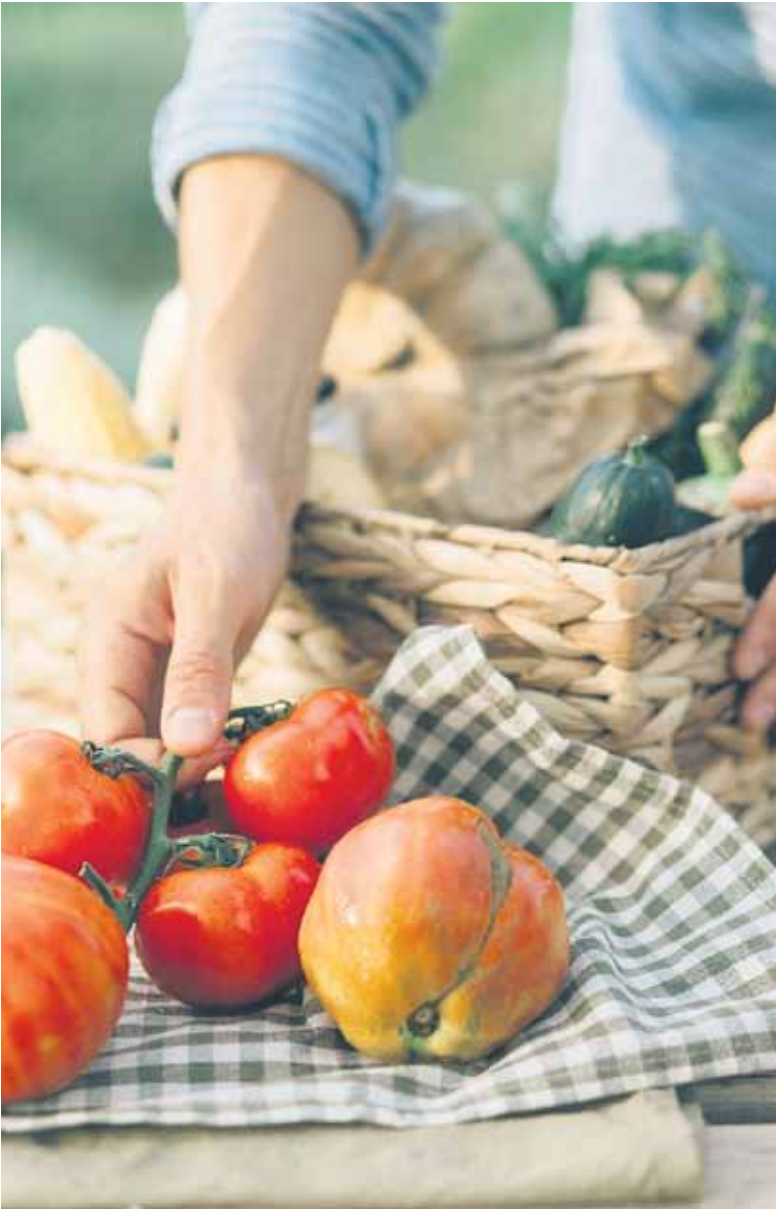
Den Einkauf in einen wiederverwendbaren Korb packen.

Tipps für mehr Regionalität und Nachhaltigkeit im Einkaufswagen