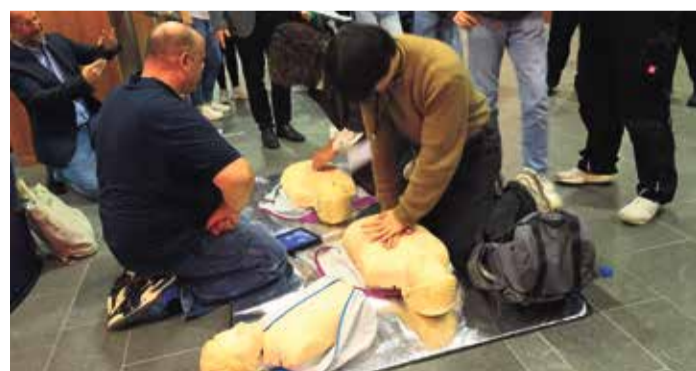
Reanimationsübung anhand einer Puppe.