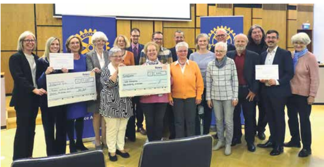
Preisträgerinnen und Preisträger mit Unterstützern der Projekte.

Inklusiver Spielplatz und Integrations-Café sind Preisträger