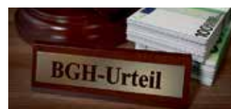
Es geht um viel Geld

rungsverträge auch heute noch anfechtbar. Man nennt dies „ewiges Widerrufsrecht“. Bei einem Widerruf erhalten Sie – anders als bei der Kündigung – alle eingezahlten Beiträge ohne Abzug von Maklerprovisionen und Verwaltungskosten zurück. Und nicht nur das: die Versicherung muss Sie auch an dem mit Ihrem Geld erzielten Anlagegewinn beteiligen. So können Sie bis zu 150% der eingezahlten Beiträge zurückholen. Ein sattes Plus auf Ihrem Konto winkt!