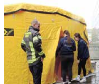
Das sog. Rauchzelt der Feuerwehr Langen vermittelt einen Eindruck akuter Rauchbildung im geschlossenen Raum.