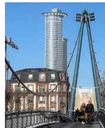
Blick zum Haus Windmühlstraße 1 vom Holbeisteg aus.

Das Nizza in Frankfurt am Main ist ein charmanter Landschaftsgarten am nördlichen Mainufer, der seit dem 19. Jahrhundert die Stadtbewohner und Besucher gleichermaßen verzaubert. Benannt nach der französischen Riviera-Stadt, bietet dieser etwa 1,2 Hektar große Park eine beeindruckende Vielfalt an exotischen Pflanzen, die dank des milden Mikroklimas hier gedeihen. Der Park ist nicht nur ein botanisches Kleinod, sondern auch ein beliebter Treffpunkt für Erholungsuchende und Naturliebhaber. Mit seinen verschlungenen Wegen, idyllischen Sitzgelegenheiten und dem malerischen Uferbereich lädt das Nizza zum Verweilen und Entspannen ein. Es ist ein einzigartiger Ort, an dem sich mediterrane Atmosphäre und Frankfurter Stadtleben auf harmonische Weise verbinden.