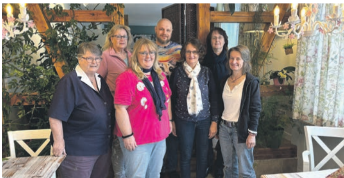
Der Vorstand erlangte bei der Klausurtagung viele neue Erkenntnisse und nutzte das gemeinsame Wochenende für die Festlegung der kommenden Aufgaben.

Klausurtagung des Vorstandes: Zu seiner ersten Klausurtagung verreiste der Vorstand des Vereins bereits Mitte September ins schöne Brombachtal im Odenwald. Dort wartete ein rundum gelungenes Programm. Die „Pension Landhaus“ mit seiner herzlichen Atmosphäre und der liebevollen Einrichtung im Landhausstil bot die perfekte Umgebung für einen intensi-