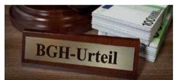
Es geht um viel Geld

rungsverträge auch heute noch anfechtbar. Man nennt dies „ewiges Widerrufsrecht“. Bei einem Widerruf erhalten Sie – anders als bei der Kündigung – alle eingezahlten Beiträge ohne Abzug von Maklerprovisionen und Verwaltungskosten zurück. Und nicht nur das: die Versicherer müssen Sie auch an dem mit Ihrem Geld erzielten Anlagegewinn beteiligen. So können Sie bis zu 150% der eingezahlten Beiträge zurückholen. Ein sattes Plus auf Ihrem Konto winkt!