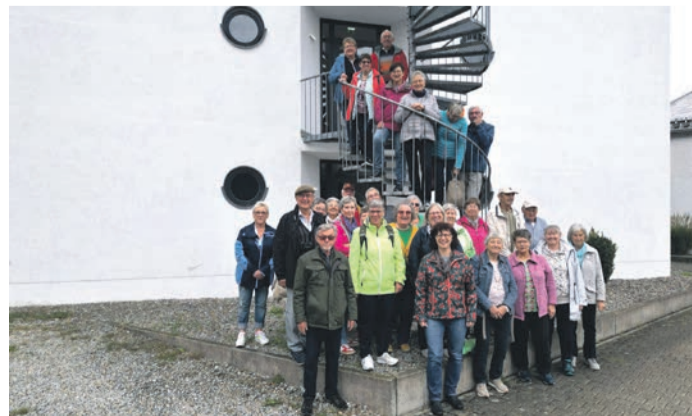
Große Arbersee, den man zu Fuß umrundete.

Münster (MA) Die Tour führte in den Bayerischen Wald nach Cham. Auf der Hinfahrt machte man Station in dem Städtchen Amberg, wo man die schöne Altstadt erkundete. Weiter ging es nach Cham, im Parkhotel hat mandann unsere Zimmer bezogen. Am erste Tag machte man eine Rundfahrt mit fachkundiger Führung. Unterwegs besuchte man eine Bärwurzerei, weiter nach Arnbruck in eine Glasbläserei und dann zum