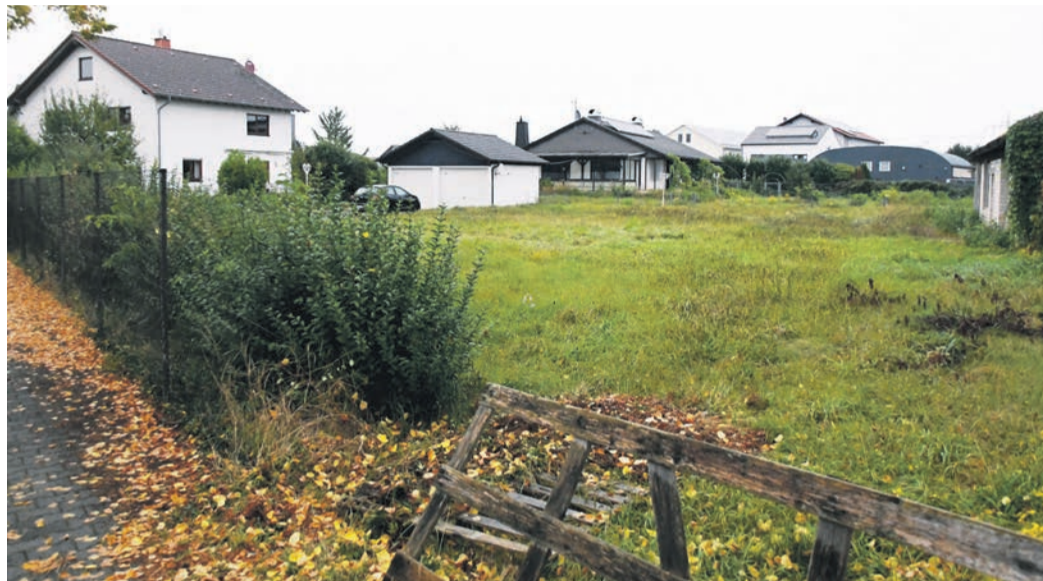
Auf diesem Grundstück im Werlacher Weg will ein privater Bauherr zwei Mehrfamilienhäuser mit insgesamt 30 Sozialwohnungen bauen. Die Münsterer Gemeindevorsteher unterstützen das mehrheitlich.

Münster (jedö) Bei der Errichtung neuer Sozialwohnungen tut sich in Münster gerade einiges. Im Baugebiet „Am Seerich“ sind parallel zur Alheimer Straße schon welche entstanden; in der Darmstädter Straße neben dem „Thai China Haus“ hat ein Investor nach längerer Debatte (besonders mit den Nachbarn) mittlerweile die Wogen geglättet und will bald loslegen. Ein drittes Projekt ist ebenfalls in der Pipeline: Ein privater Bauherr plant im Werlacher Weg in zwei Objekten 30 Wohnungen, für die zunächst die Kommune das Belegungsrecht erhalten soll. Die Gemeindevorsteher beschloss in ihrer September-Sitzung dazu unter anderem eine Finanzierungsbeihilfe, was bei 17:16 Stimmen eine hauchdünne Mehrheit fand. Grund: SPD, FDP und ALMA-Die Grünen waren dafür, die CDU als deutlich größte Fraktion in Münster dagegen. Der Beschlussvorschlag sah vor, dass die Gemeinde dem Bauträger für den Zeitraum von 50 Jahren ein zinsloses Darlehen von 300 000 Euro - 10 000 Euro pro geplanter Sozialwohnung - gewähren soll. Diese investiven Mittel müssen in den Gemeinde-Haus-