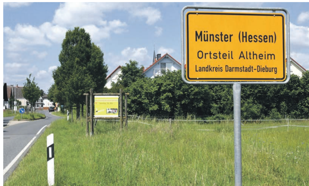
2600 Menschen wohnen in Altheim, 18 Prozent der Gesamtbevölkerung der Gemeinde Münster. Die Wahlberechtigten im Ortsteil dürfen im Frühjahr 2026 erstmals einen Ortsbeirat wählen.

CDU stellt ähnlichen Antrag beim zweiten Mal mit Erfolg / Wahl im Frühjahr 2026