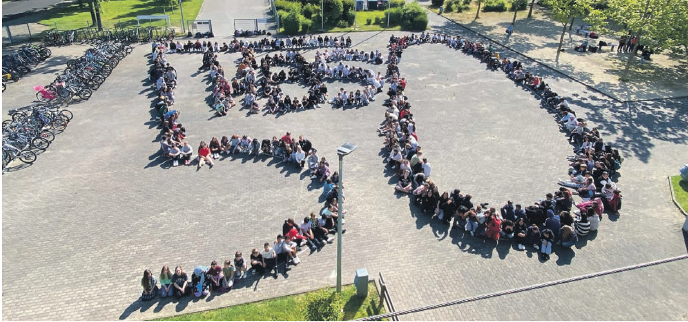
HBS-Schülerinnen und Schüler im Jubiläumsjahr 2024.