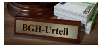
Es geht um viel Geld

Das bedeutet für Sie: Sie können nur gewinnen, denn Sie bezahlen nur einen Anteil des für Sie bei Ihrer Versicherung erzielten Mehrwertes an das Verbraucherportal. Ein fairer Deal, denn das Geld, das Sie ohnehin von der Versicherung erhalten hätten, bleibt komplett unangetastet. Das Unternehmen hat bereits über 50 Millionen Euro an seine Kunden ausbezahlt.