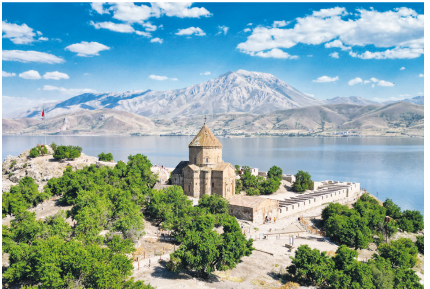
Die über 1.000 Jahre alte Kirche zum Heiligen Kreuz auf der Insel Akdamar.

Premiere der neuen Live-Reportage von Stefan Seibold, Samstag, 2.11., 19:30 Uhr Sportheim Erzhausen