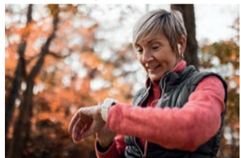
Pulsmessen mit Smartwatch

Jeder fünfte Schlaganfall ist auf Vorhofflimmern (VHF) zurückzuführen, die häufigste anhaltende Herzrhythmusstörung. Deshalb nimmt die „Initiative Herzstolpern“ den Welt-Schlaganfalltag am 29.10. zum Anlass, über Möglichkeiten zur Früherkennung dieses häufig übersehenen Risikos zu informieren. Smartwatches sind mit einer Vielzahl von Sensoren ausgestattete Mini-Computer am Handgelenk, die Gesundheitsdaten wie Schrittzahl und Pulskurven aufzeichnen. Einige können sogar ein Elektrokardiogramm (EKG) erstellen und VHF erkennen. Das kann einen wichtigen Beitrag zur Früherkennung und Schlaganfallprävention leisten, da diese Herzrhythmusstörung aufgrund ihrer unklaren Symptome wie Herzrasen und -stolpern, Müdigkeit, Schwindel und Schlafstörungen oft lange unerkannt bleibt. Die von der Uhr aufgezeichneten EKG-Kurven können Ärzt:innen eine wertvolle Hilfe bei der Diagnostik sein. Studien zeigen, dass EKG-Smartwatches in der Empfindlichkeit und Signalqualität bei der Erkennung von VHF einem herkömmlichen Langzeit-EKG nicht nachstehen. Gerade für Menschen mit einem erhöhten Risiko für VHF wie Ältere und von Bluthochdruck oder Übergewicht Betroffene kann das Tragen einer Smartwatch daher sehr sinnvoll sein. Weitere Informationen unter www.herzstolpern.de .