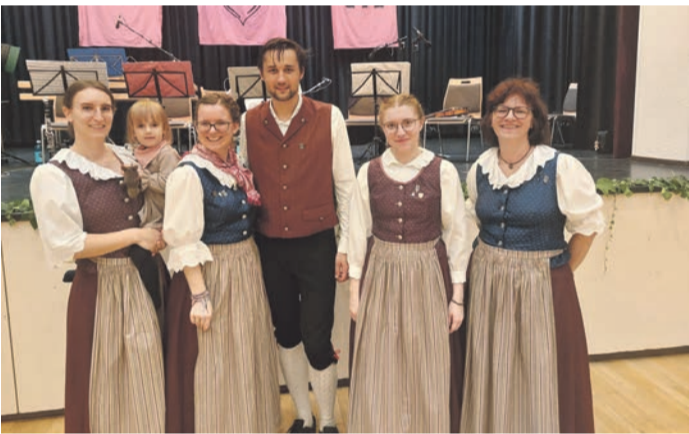
Einige Tänzerinnen der Trachten- und Folkloregruppe der Wandergesellschaft Frisch-Auf, besuchten Ende September das beliebte Volkstanzfest in Schaaheim. Veranstalter des Festes war die Deutsche Wanderjugend - Landesverband Hessen / AG Spielschar.

Mandolinenorchester: Das Orchester nimmt am Samstag, 16. November, bei der Hessischen Orchesterbegegnung in Schlitz teil. Der Auftritt wird gewertet und man hat 30 Minuten Spielzeit. Man wird größtenteils Stücke aus dem letzten Konzert spielen.