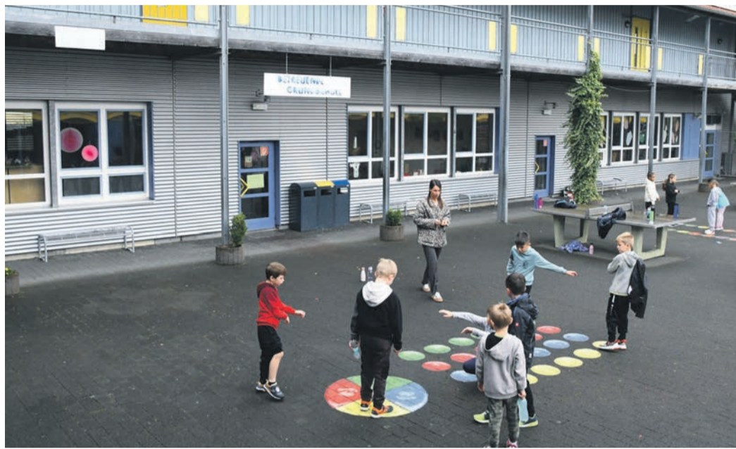
„Betreuende Grundschule“ steht über dem Eingang zu den entsprechenden Räumen der Stephan-Gruber-Schule. Auch dort zeichnet nun der Landkreis für die Nachmittags- und Ferienbetreuung verantwortlich.