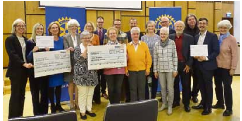
Preisträgerinnen und Preisträger mit Unterstützern der Projekte.

In diesem Jahr wurden zum einen das Projekt Café Grenzenlos in Neu-Isenburg ausgezeichnet. Im von der evangelisch-reformierte Gemeinde am Marktplatz in Kooperation mit der Flüchtlingshilfe Neu-Isenburg ins Leben gerufenen Café können an jedem ersten Mittwoch im Monat alle Menschen mit Fluchterfahrung und