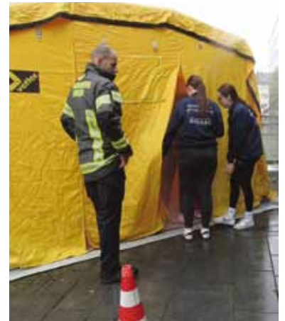
Das sog. Rauchzelt der Feuerwehr Langen vermittelt einen Eindruck akuter Rauchbildung im geschlossenen Raum.

Rund 200 Schüler aus zahlreichen Schulen der Region nahmen an dem zentralen Training teil. Die Schulen erhielten zunächst umfangreiches Fachwissen zur Herzdruckmassage und im Anschluss fand ein Workshop in Kleingruppen mit Reanimationspuppen und Übungs-Defibrillatoren statt. Die Kosten von 60.000 Euro für die Reanimations-trainings-Puppen und Übungs-AEDs tragen die Kinderhilfestiftung, die Asklepios Klinik Langen, der Rotary Club Offenbach-Dreieich, die Stiftung des Kreises Offenbach sowie einzelne Unternehmen.