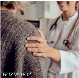
Adipositas erhöht das Risiko für gesundheitliche Komplikationen

Adipositas beeinflusst den Alltag: Menschen mit Übergewicht sind oft mit Vorurteilen und Diskriminierung konfrontiert. Starkes Übergewicht hat jedoch auch Auswirkungen auf die Organe und wird mit über 200 Folgeerkrankungen in Verbindung gebracht. Die Ursachen von Adipositas werden zunehmend genauer erforscht – und damit eröffnen sich neue Wege beim Gewichtsmanagement.