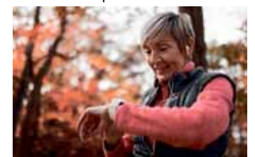
Pulsmessen mit Smartwatch

Weitere Informationen unter www.herzstolpern.de .