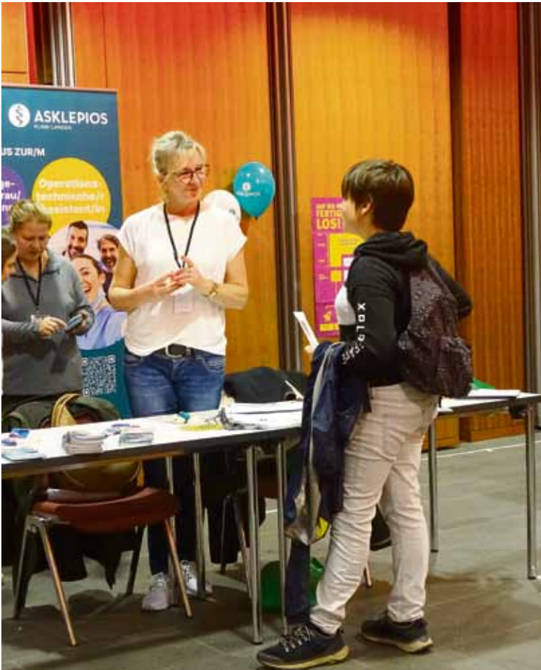
Im Ausstellungsraum finden sich zahlreiche Stände, an den die Schülerinnen und Schüler mehr zu unterschiedlichen Themen erfahren können.

Reanimations-Workshop für Schulen im der Region