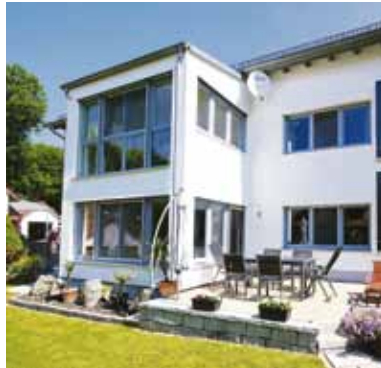
Gesunde Raumluft mit der Kraft der Sonne: Eine solare Lüftung lässt sich bei wenig Aufwand einfach raumweise nachrüsten.

(DJD-K). Nicht nur Menschen brauchen Luft zum Leben. Auch Gebäude sind auf eine regelmäßige Frischluftzufuhr angewiesen, sonst können sie buchstäblich krank werden - bis zu einem Schimmelbefall oder Schäden an der Bausubstanz. Gerade bei Objekten, die nur zeitweise genutzt und somit selten gelüftet werden, sowie in Kellerräumen stellt ein mangelnder Luftaustausch eine große Herausforderung für die Besitzer dar.