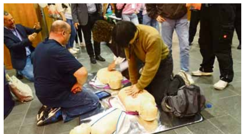
Reanimationsübung anhand einer Puppe.