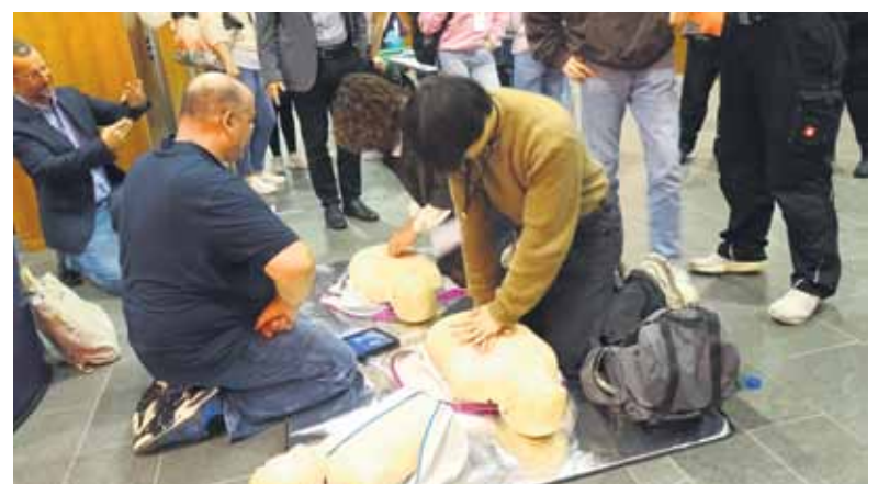
Reanimationsübung anhand einer Puppe.