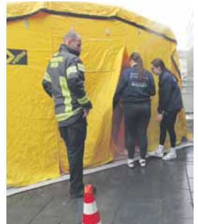
Das sog. Rauchzelt der Feuerwehr Langen vermittelt einen Eindruck akuter Rauchbildung im geschlossenen Raum.

Rund 200 Schüler aus zahlreichen Schulen der Region nahmen an dem zentralen Training teil. Die Schulen erhielten zunächst umfangreiches Fachwissen zur Herzdruckmassage und im Anschluss fand ein Workshop in Kleingruppen mit Reanimationspuppen und Übungs-Defibrillatoren statt. Die Kosten von 60.000 Euro für die Reanimations-trainings-Puppen und Übungs-AEDs tragen die Kinderhilfestiftung, die Asklepios Klinik Langen, der Rotary Club Offenbach-Dreieich, die Stiftung des Kreises Offenbach sowie einzelne Unternehmen.