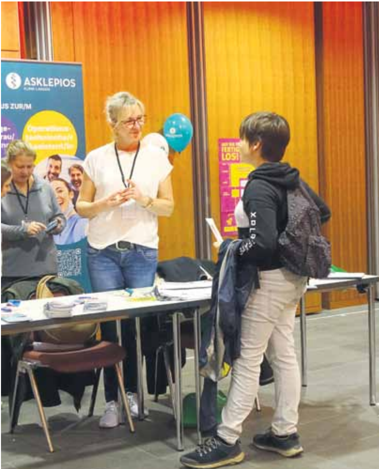
Im Ausstellungsraum finden sich zahlreiche Stände, an den die Schülerinnen und Schüler mehr zu unterschiedlichen Themen erfahren können.

Reanimations-Workshop für Schulen im der Region