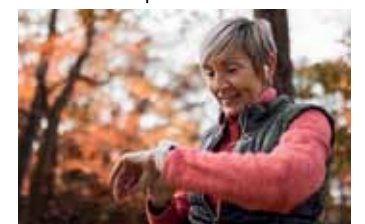
Pulsmessen mit Smartwatch

Weitere Informationen unter www.herzstolpern.de .