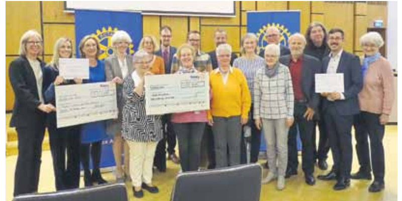
Preisträgerinnen und Preisträger mit Unterstützern der Projekte.

In diesem Jahr wurden zum einen das Projekt Café Grenzenlos in Neu-Isenburg ausgezeichnet. Im von der evangelisch-reformierte Gemeinde am Marktplatz in Kooperation mit der Flüchtlingshilfe Neu-Isenburg ins Leben gerufenen Café können an jedem ersten Mittwoch im Monat alle Menschen mit Fluchterfahrung und