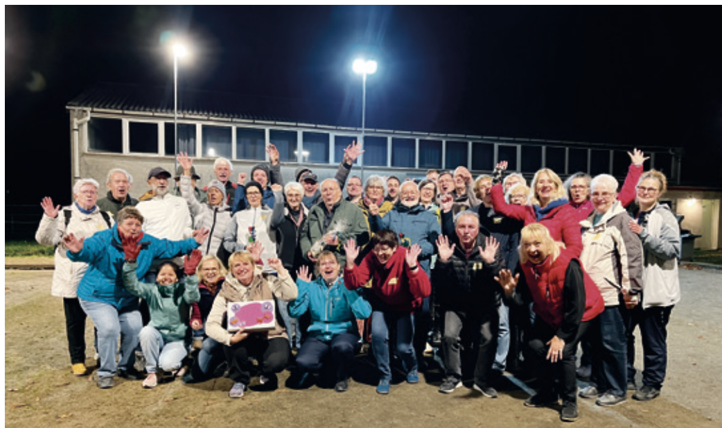
Da strahlt nicht nur das Flutlicht: Viele glückliche Gesichter gab es beim ersten Teil des Boule-Kegel-Duathlons 2024.

Arheilgen (kt). Was am 13. Oktober 2024 im Arheilger Boulodrome stattfand, war gelungener Saisonabschluss für die Boule-Abteilung und Freundschaftsfest in einem.