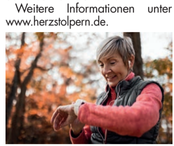
Pulsmessen mit Smartwatch

Smartwatches sind mit einer Vielzahl von Sensoren ausgestattete Mini-Computer am Handgelenk, die Gesundheitsdaten wie Schrittzahl und Pulskurven aufzeichnen. Einige können sogar ein Elektrokardiogramm (EKG) erstellen und VHF erkennen. Das kann einen wichtigen Beitrag zur Früherkennung und Schlaganfallprävention leisten, da diese Herzrhythmusstörung aufgrund ihrer unklaren Symptome wie Herzrasen und -stolpern, Müdigkeit, Schwindel und Schlafstörungen oft lange unerkannt bleibt. Die von der Uhr aufgezeichneten EKG-Kurven können Ärzt:innen eine wertvolle Hilfe bei der Diagnostik sein. Studien zeigen, dass EKG-Smartwatches in der Empfindlichkeit und Signalqualität bei der Erkennung von VHF einem herkömmlichen Langzeit-EKG nicht nachstehen. Gerade für Menschen mit einem erhöhten Risiko für VHF wie Ältere und von Bluthochdruck oder Übergewicht Betroffene kann das Tragen einer Smartwatch daher sehr sinnvoll sein.