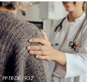
Adipositas erhöht das Risiko für gesundheitliche Komplikationen

Ärztinnen und Ärzte können bei Fragen zu medikamentösen Therapiemöglichkeiten beraten. Weitere Informationen unter www.MeinWegmitAdipositas.de .