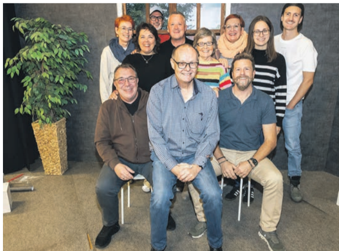
Viel will das Ensemble noch nicht über das neue Stück verraten.

„Die Bubenmacher“ ist eine Komödie in drei Akten von Bernd Kietzke, aber wie man es von „Lach Mal“ kennt, wird es auf Obertshausen angepasst sein. Viel will das Ensemble noch nicht verraten, nur, dass die weiblichen Bewohner des kleinen Dorfes seit Generationen ein pikantes Geheimnis hüten. Durch eine Laune der Natur werden von allen Männern, die mehr als drei Monate im Ort leben, nur Mädchen gezeugt. Ist ein Stammhalter erwünscht, wird der „Bubenmacher“ bestellt. Die Männer im Dorf sollen davon aber nichts mitbekommen. Ein eigentlicher Routinefall, verläuft für