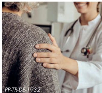
Adipositas erhöht das Risiko für gesundheitliche Komplikationen

Medikamentöse Behandlungsmöglichkeiten können das Abnehmen unterstützen. Kombiniert mit gesunder Ernährung und mehr Bewegung können diese Medikamente Menschen mit Adipositas dabei helfen, ihr Körpergewicht zu reduzieren und so ihre Lebensqualität zu verbessern. Ärztinnen und Ärzte können bei Fragen zu medikamentösen Therapiemöglichkeiten beraten. Weitere Informationen unter www.MeinWegmitAdipositas.de .