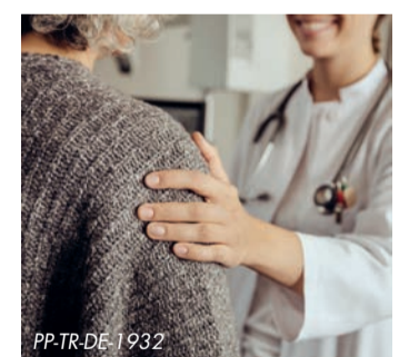
Adipositas erhöht das Risiko für gesundheitliche Komplikationen

Adipositas beeinflusst den Alltag: Menschen mit Übergewicht sind oft mit Vorurteilen und Diskriminierung konfrontiert. Starkes Übergewicht hat jedoch auch Auswirkungen auf die Organe und wird mit über 200 Folgeerkrankungen in Verbindung gebracht. Die Ursachen von Adipositas werden zunehmend genauer erforscht – und damit eröffnen sich neue Wege beim Gewichtsmanagement.