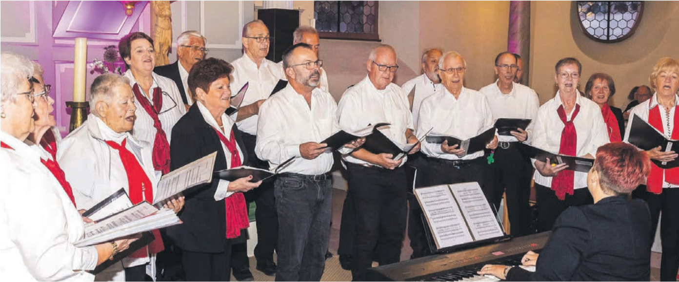
Der Volkschor Dudenhofen erfreute das Publikum auch in diesem Jahr in der stimmungsvoll beleuchteten Kirche.