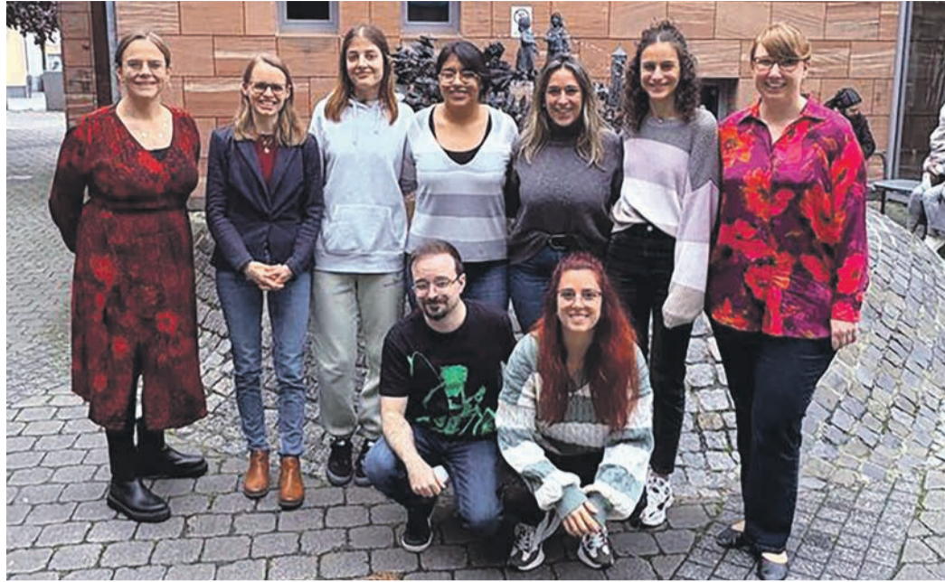
Rodgau streckt nicht zum ersten Mal seine Fühler nach Erzieherinnen und Erziehern aus Spanien aus.

Rodgau betreibt derzeit 17 eigene Kitas und spürt den Fachkräftemangel ebenfalls. Auch hier gilt es kindgerechte Personalausstattung, ein ausreichendes Betreuungsplatzangebot und letztlich im Wettbewerb um qualifiziertes Personal die besseren Karten zu haben, unter einen Hut zu bringen.