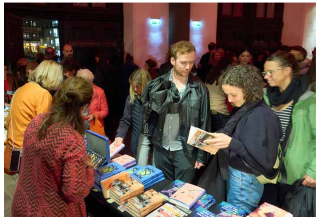
Büchertisch in den Römerhallen.

13.000 Besucherinnen und Besucher bei OPEN BOOKS