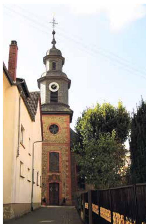
Das Berkersheimer „Wahrzeichen“

tischen Fachwerk und dem Dachreiter prägt es das Bild des historischen Ortskerns. Ursprünglich als Verwaltungssitz und Gerichtsgebäude genutzt, dient es heute als Bürgerhaus und Veranstaltungsort. Im Erdgeschoss befindet sich ein gemütlicher Gastraum, der von den Einwohnern gerne als Treffpunkt genutzt wird. Das Obergeschoss beherbergt einen Saal für kulturelle Veranstaltungen und Feste.