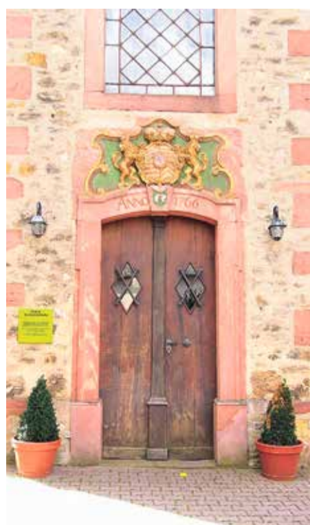
Die Tür der Kirche mit unverkennbarem Wappen an der Oberseite.