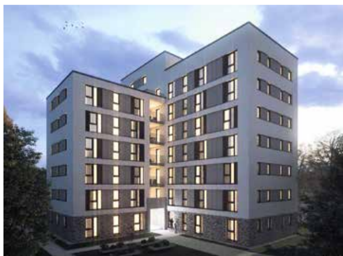
ABBILDUNG: BAUVEREIN KATHOLISCHE STUDENTENHEIME E. V.