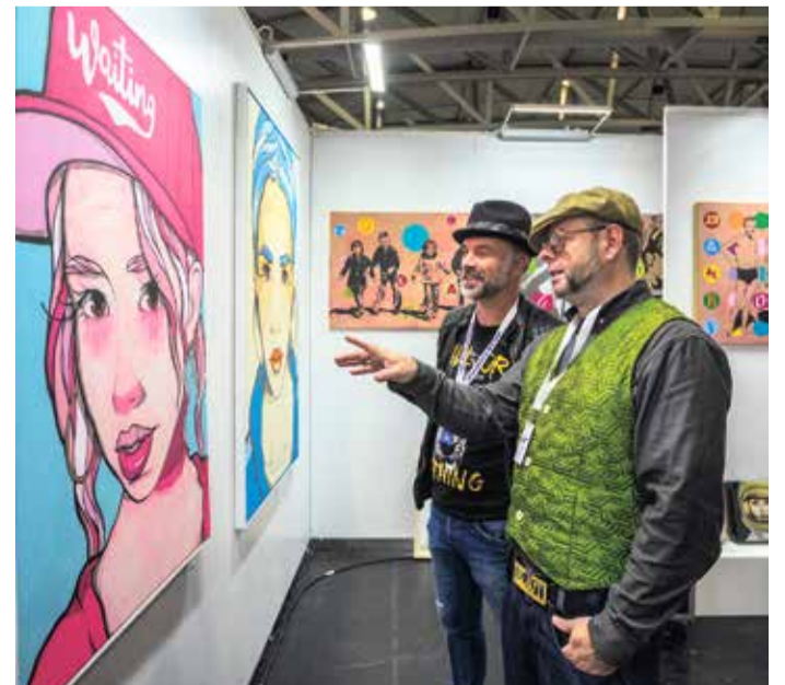
Stand der Galerie art42 auf der Messe.

laden die Organisatoren eine handverlesene und facettenreiche Gruppe von Künstlerinnen und Künstlern ein, sich während des gesamten Messezeitraums am großen Tisch im Herzen der Messe zu treffen, ihre Kunst in freier spartenübergreifender Form zu präsentieren und direkt von der Wand zu verkaufen. Vor allem soll es dort aber zu lebendigen, inspirierenden und außergewöhnlichen Begegnungen kommen – sowohl unter den Kunstschaffenden selbst als auch im Austausch mit Galeristen, Sammlern, Kritikern und mit allen, die das Messeevent mit Neugier und Entdeckerfreude besuchen.