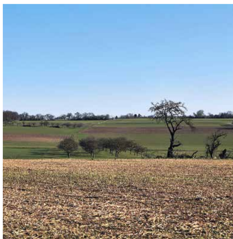
Landschaft pur, so weit das Auge reicht.