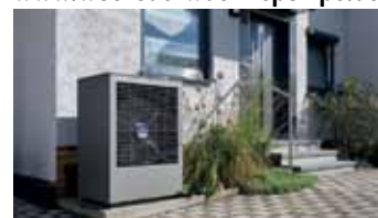
TNC Production GmbH/Sascha Linke