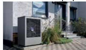
TNC Production GmbH/Sascha Linke