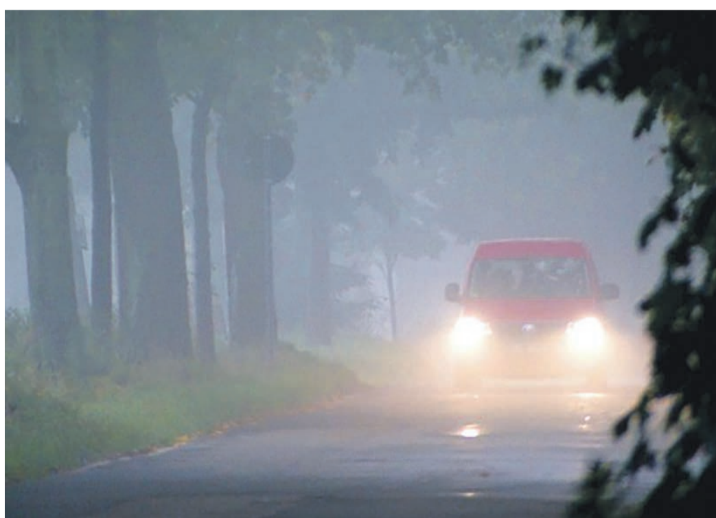
Im Herbst wird der Blick auf die Straße häufig von Nebel verdeckt.

„Wer zum Autofahren eine Brille tragen muss, sollte besonders darauf achten, die Brillengläser schlierenfrei zu halten“, empfiehlt Oliver Reidegeld, Sprecher des ADAC Hessen-Thüringen. Sonnenbrillen sind bei tief stehender Sonne nur bedingt eine Hilfe. Einerseits wird durch die Sonnenbrille die störende Sonneneinstrahlung reduziert, andererseits