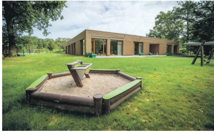
Kita Badstraße - eine der neuesten geschaffenen Kitas

Obertshausen (NZO) Die Stadt Obertshausen erweitert ihr Angebot an Betreuungsplätzen für Kinder mit einer Reihe von Projekten, um den steigenden Bedarf in der Region zu decken und eine zeitgemäße, naturnahe Betreuung sicherzustellen. Im Fokus stehen dabei die Umnutzung bestehender Räumlichkeiten, der Einsatz neuer Holzbauwagen und der Bau neuer Einrichtungen. Bürgermeister Manuel Friedrich betont: „Wir investieren weitere Millionen in die Zukunft unserer Kinder und schaffen wichtige Betreuungsangebote für alle Altersgruppen.“ In der Kita Thomas Morus werden bisherige Horträume in eine neue Kindergartengruppe umgewandelt. Die Betriebsereignis wurde im August 2024 erteilt, und die Umsetzung er-