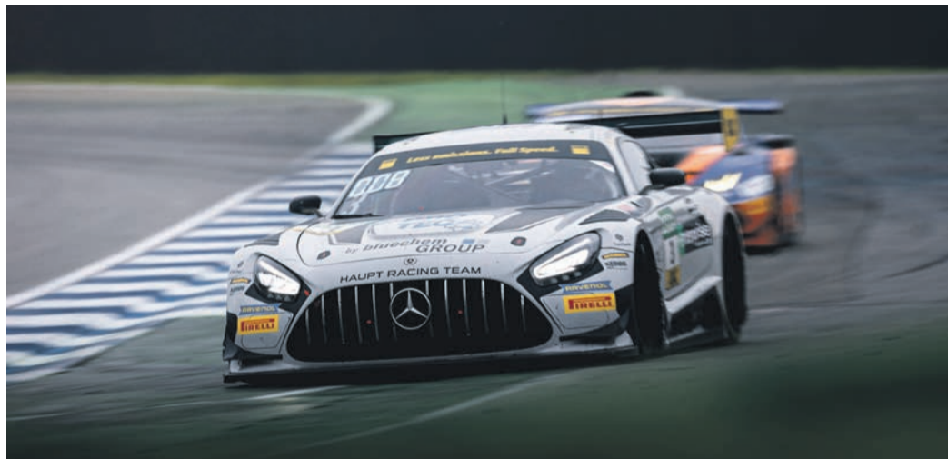
Die Debütsaison endete mit einem packenden Rennen auf dem Hockenheimring.

Nach dem ersten ADAC GT Masters-Sieg auf dem Red Bull Ring wollte Finn Wiebelhaus beim Finale der Sportwagenreihe nochmal überzeugen. In den freien Trainings legte er direkt stark los und fuhr Bestzeit. Die Ausgangslage war vielversprechend, doch es folgten aufregende Renntage. Im Qualifying am Samstag war die Strecke halbtrocken,