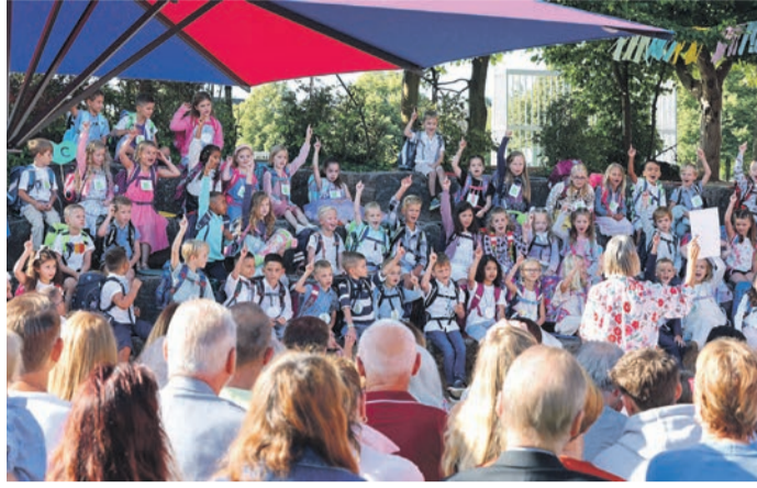
1.175 Kinder werden derzeit an Rödermarks Grundschulen unterrichtet. 528 davon an der Schule an den Linden in Urberach, hier ein Bild von der Einschulung Ende August.

Laut Kita-Bedarfsplan gibt es in Rödermark 1.101 Plätze (876 in städtischen Einrichtungen, 225 bei Freien Trägern) in den Ü3-Einrichtungen. Diese laut Betriebsurlaub der einzel-