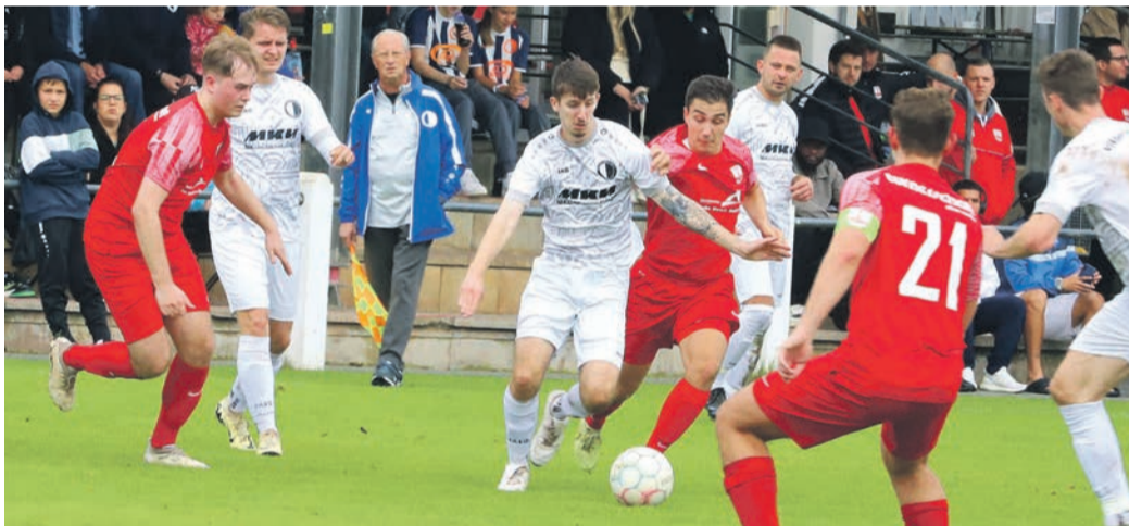
Die zweite Mannschaft der TS (rote Trikots) besiegte die Viktoria im A-Liga-Derby mit 2:1.