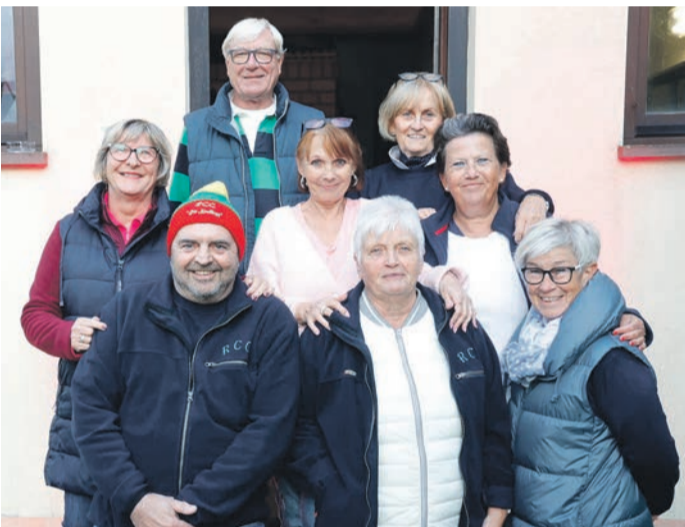
Jedes Jahr ein gern gesehener Gast: Der Musikverein „Frohsinn“ Grosswallstadt überzeugte auch heuer wieder mit seinen Darbietungen.