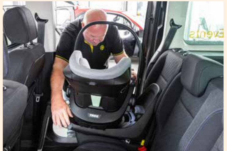
Eine Drehfunktion erleichtert Eltern das Fixieren des Kindersitzes

Insgesamt fällt auf, dass zahlreiche Babyschalen und Kleinkindersitze über Zusatzfunktionen verfügen, die den Transport für Eltern und Kinder bequemer machen. Mit einer Drehfunktion kann der Sitz zum einfachen Anschlachten des Kindes um 90 Grad zur Seite gedreht werden, und