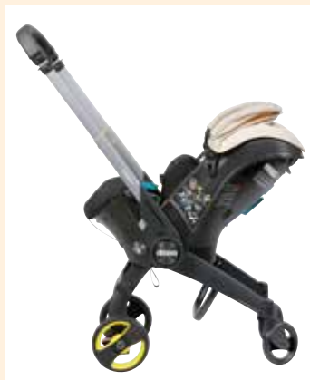
Die Babyschale von Doona verfügt über ein integriertes Fahrgestell, das sich ein- und ausklappen lässt.

Weil der Verbrauchertrend hin zu Kindersitzen mit Isofix-Befestigung geht, weist der ADAC darauf hin, dass ein selbstständiges Nachrüsten von Isofix-Kits große Gefahren birgt, weil zum Beispiel der Fahrzeugsitz bei einem Unfall mit Kräften belastet werden kann, denen er nicht standhält. Isofix-Verankerungen im Auto müssen nach UN Reg. 145 genehmigt sein. Diese Zulassung ist immer fahrzeugspezifisch, denn es wird das Gesamtsystem aus Isofix-Ankerpunkten, Fahrzeugsitz, Sitzunterkonstruktion bis hin zur Fahrzeugstruktur geprüft. Ein nachträglicher Einbau von Isofix-Befestigungspunkten ist nur dann möglich, wenn der Fahrzeughersteller selbst entsprechende Teilesätze zum Nachrüsten anbietet. Weitere Informationen finden Sie unter adac.de (Quelle: ADAC)