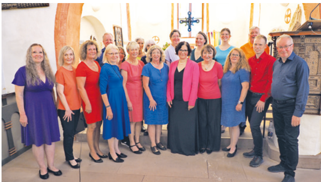
Die Voices@Merck bei ihrem letzten Konzert im Sommer in Krofdorf.