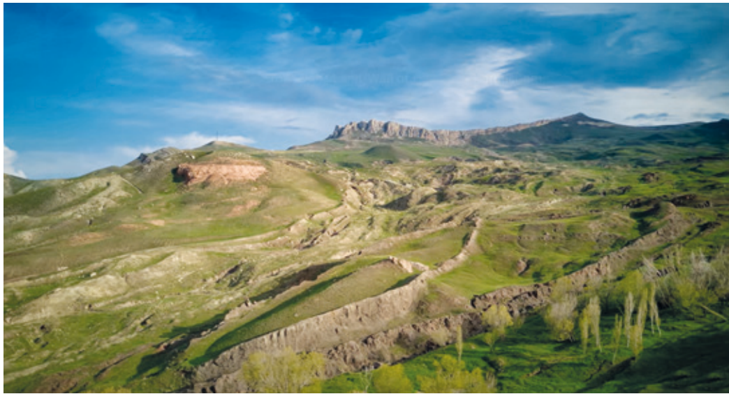
An der heutigen türkisch-iranischen Grenze soll die Arche Noah gestrandet sein.

Erzhausen (StS) Ararat – ein Berg, umrahmt von Legenden. Ob Noah hier wirklich gelandet ist, bleibt der Fantasie überlassen. Auf dem Bild ist der vermeintliche Landeplatz der Arche zu sehen: Ein kahler, felsiger Gebirgszug, auf dem Noah Ausschau nach Land gehalten haben soll. Die Sonne taucht die schneebedeckten Hänge des Ararats in ein warmes Licht, und der Wind pfeift durch die Felsen, als wolle er die Geheimnisse des Berges lüften. Eines ist sicher: Die Aussicht von hier oben ist atemberaubend. Das Auge schweift über endlose Weiten, und man fühlt sich wie ein kleiner Punkt in einer großen Welt. Wir begeben uns auf eine Reise in die Vergangenheit, um den Spuren der Geschichte zu folgen und vielleicht ein Stückchen vom Mythos zu erhaschen. Vielleicht weht hier noch der Atem der Arche Noah?