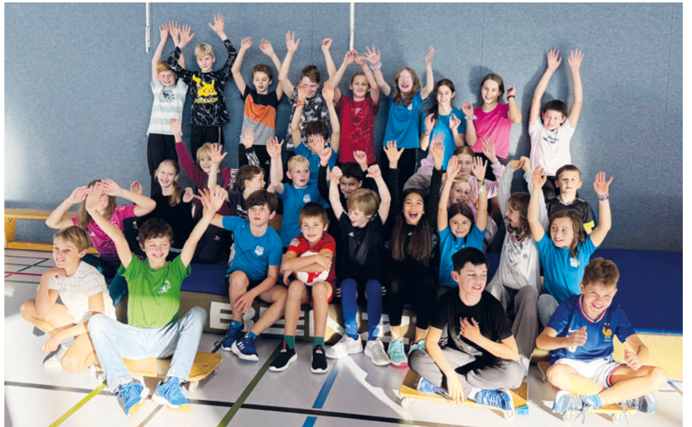
Die Leichtathletik Sportraketen der TSG Wixhausen.

(ist). Zu einer gemeinsamen Übernachtung trafen sich am Freitag, den 25.10., 31 Leichtathleten und 5 Trainer in der Sporthalle der TSG Wixhausen. Auf dem Programm standen Sport- und Gruppenspiele, ein gemeinsames Abendessen, eine Schnitzeljagd mit Nachtwanderung und ein Film. Nach nicht all zu viel Schlaf und einem Frühstück am nächsten Morgen ging ein tolles Event für alle zu Ende. Hast Du auch Lust auf gemeinsame Events, Spiel, Spaß und Leichtathletik? Einfach vorbeischaun zu den Übungsstunden oder E-Mail an probe@leichtathletik-wixhausen.de Alle Infos auch online unter: leichtathletik-wixhausen.de