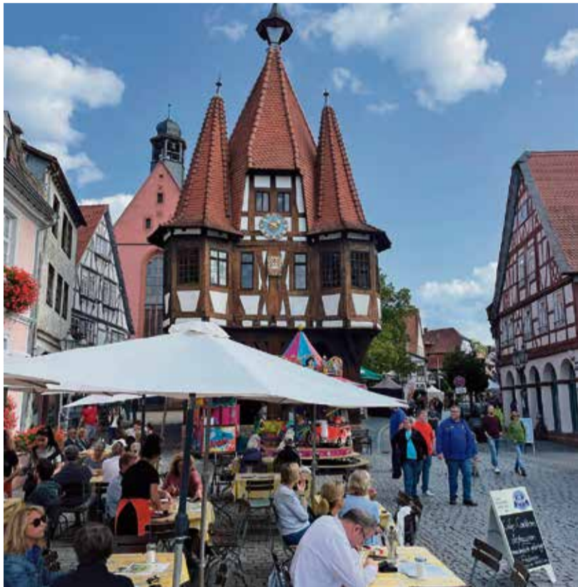
Das Weinbrunnenfest im letzten Jahr.

Der Kerweclub Michelstadt feiert in diesem Jahr sein 25-jähriges Jubiläum. Die Vereinsmitglieder erinnern mit dem Motto „Sellems“ auf ihren T-Shirts an die schönen Zeiten, die sie nun ein Vierteljahrhundert lang miteinander verbracht haben. Die Kerbredd' steht auch unter dem Motto „Sellems“ und wird vier Mal vorgetragen: Am Kirchplatz, am Lindenplatz, im Kellereihof und im