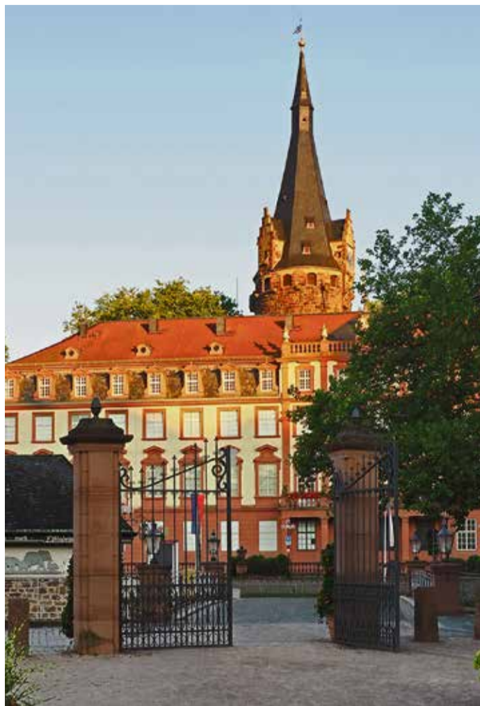
Das Schloss in der zweiten Jahreshälfte.

Ab dem ersten Advent starten die „Nachts im Schloss“ Führungen. Jeden Samstag von 18-19 Uhr gehen die Schlossbesucher im Laternenschein auf eine Reise durch die Gemächer