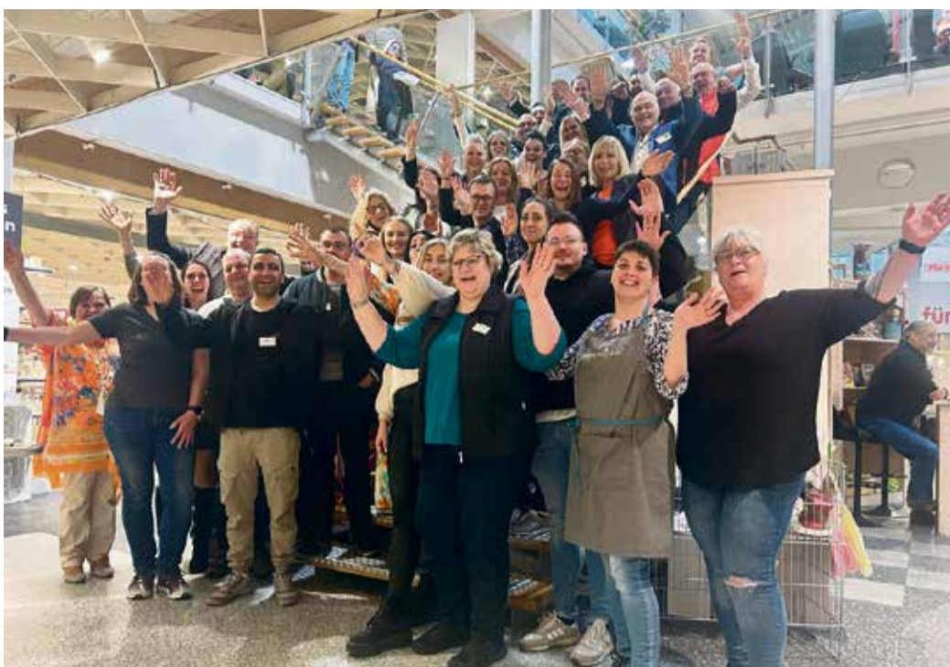
Der Spaß kann losgehen – die Aussteller freuen sich auf die aufregende Messe.

Für Informationen und bleibende Eindrücke sorgen einmal mehr die Modenschau mit Beas kleiner Boutique und eine Trial-Show mit Rodney Bearer, der im September gemeinsam mit zwei weiteren Startern im spanischen Pobladora de las Regueras beim FIM Trial