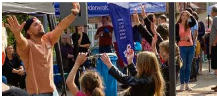
Karims Tanzschule heizte bereits 2023 dem Publikum ein.

fee und Kuchen angeboten, das Taklit-Theater gibt zweimal das neueste Bühnenprogramm „Cesare – Sound of Rotkäppchen“ zum Besten. Karims Tanzschule aus Michelstadt bietet ein Rahmenunterhaltungsprogramm. red