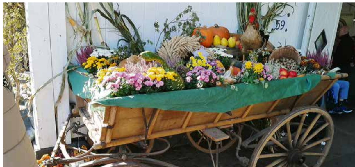
Ein ganzer Wagen voll mit Köstlichkeiten der Region – der 33. Bauernmarkt bietet ein abwechslungsreiches Angebot.

Zum 33. Mal stehen Kürbis, Kartoffel und Co. im Mittelpunkt