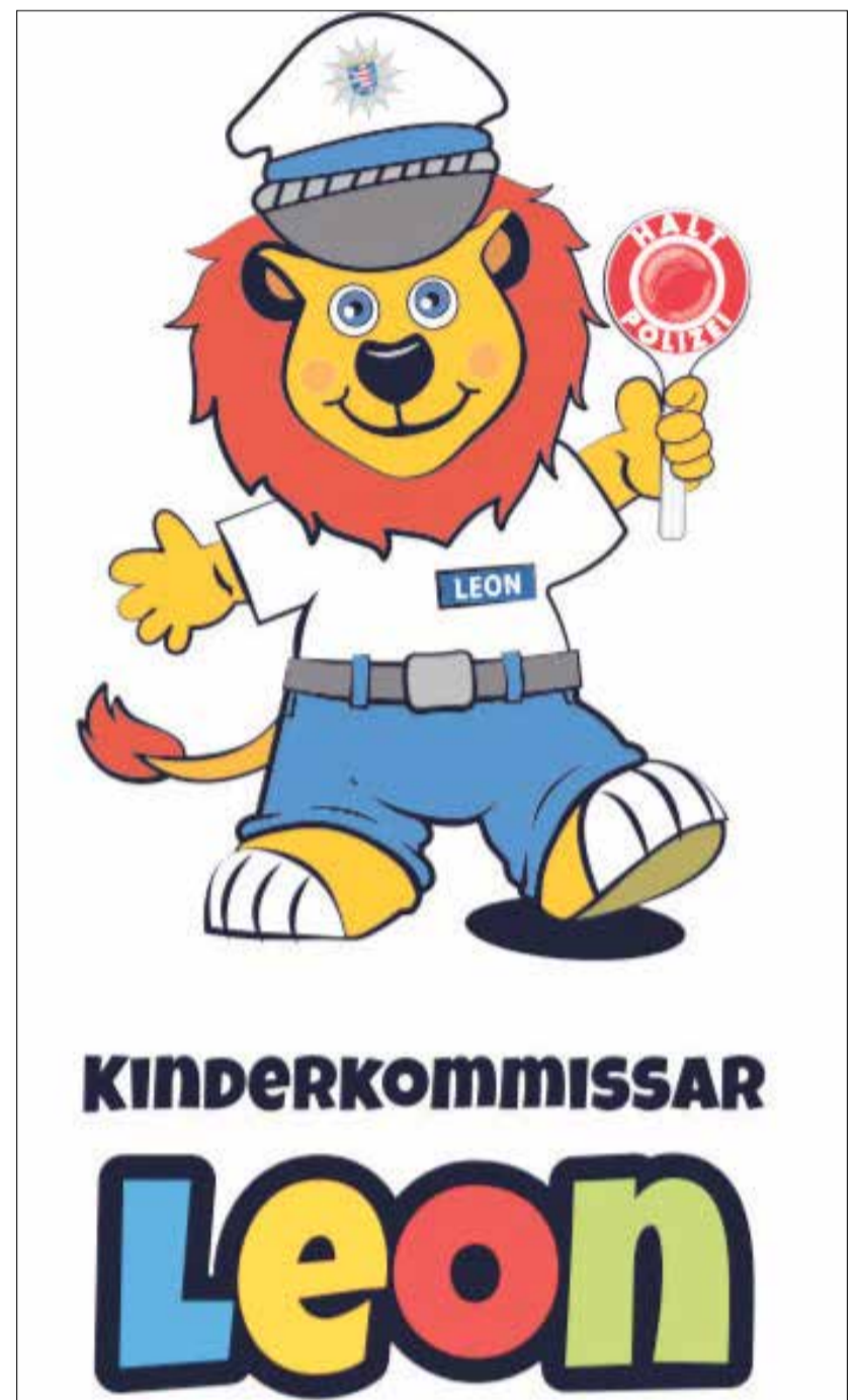
Das GZO lädt am 7. Oktober zur Eröffnung der LEON Hilfe-Insel ein.

Eine sichere Anlaufstelle für Kinder und Familien