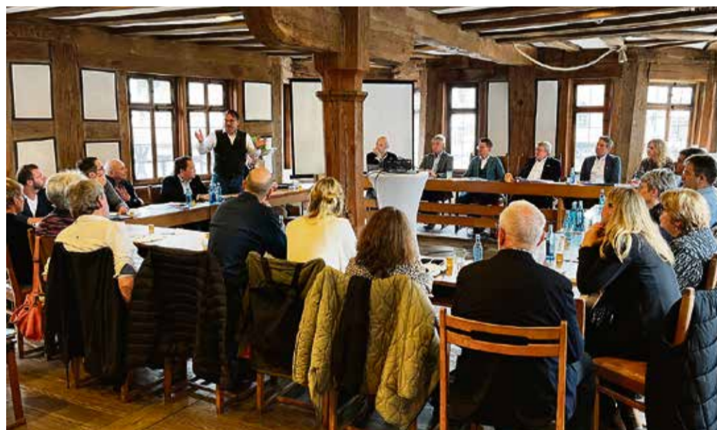
Michelstadt war kürzlich gastgebende Kommune für die dreitägige Cittaslow-Herbsttagung, zu der Vertreter von 14 Mitgliedskommunen aus ganz Deutschland angereist waren.

rasen mit seiner einzigartigen Flora und Fauna entsprechen den Zielen von Cittaslow in Bezug auf eine nachhaltige Umweltpolitik.