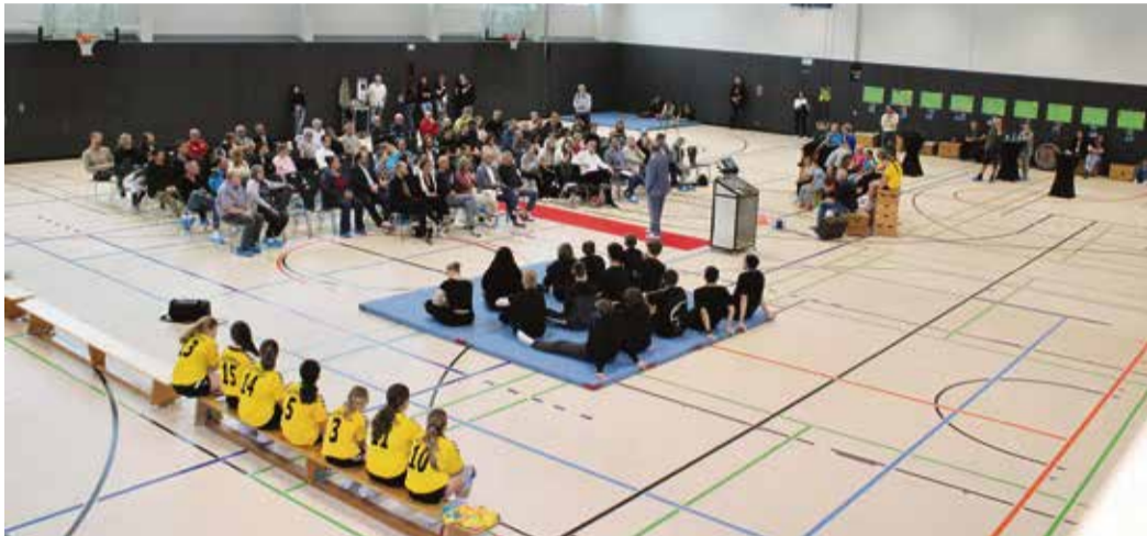
Viele Ehrengäste und natürlich Schüler waren bei der Einweihung der Sporthalle dabei.