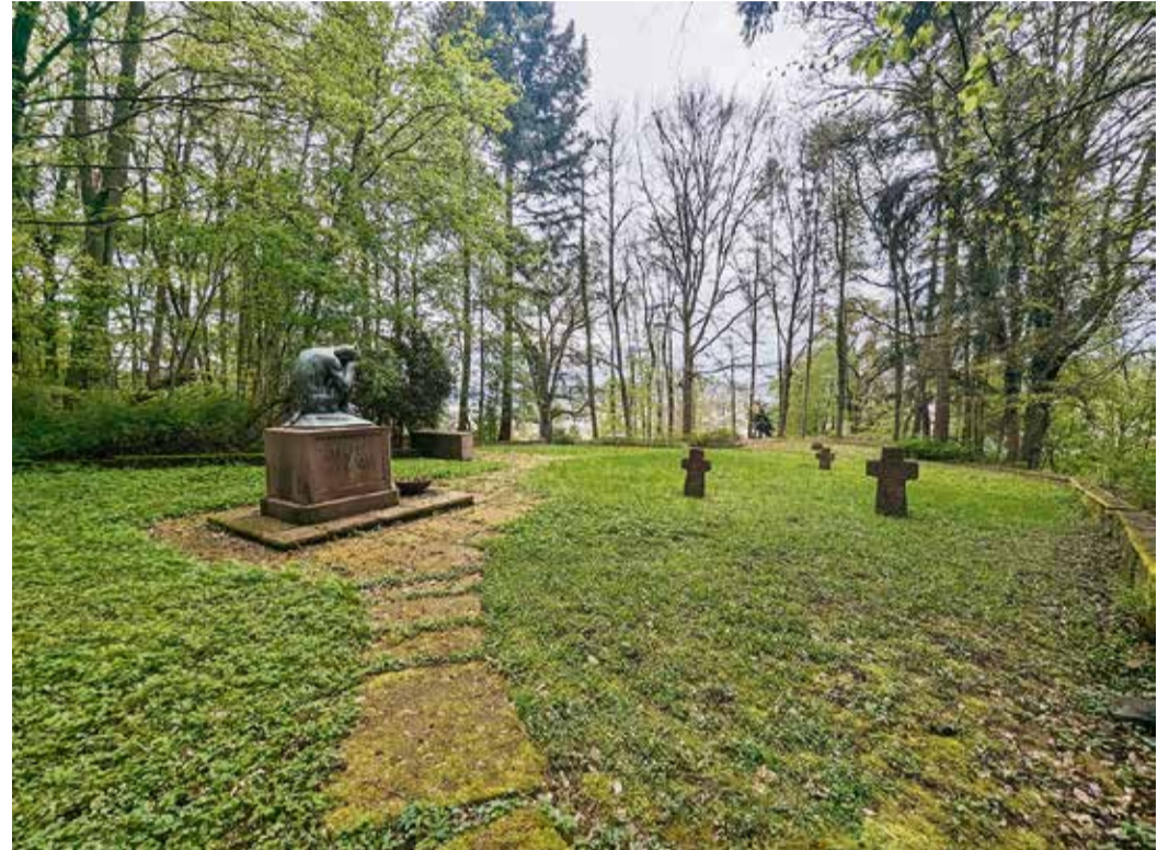
Seit hundert Jahren steht hier das Denkmal für die im Krieg Gefallenen.