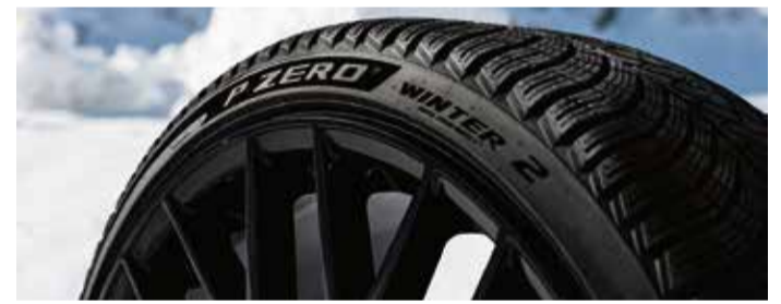
Hochgebirge? Dann empfiehlt sich ein speziell auf die Witterlage abgestimmter Winterreifen wie dieser P Zero von Pirelli.

spezielle Kennzeichnung zeigt an, dass der Reifen die Zulassungstests für die kritischsten Winterbedingungen bestanden hat. Heute tragen alle Ganzjahresreifen der neuen Generation von Pirelli dieses Symbol. Das weist darauf hin, dass diese Reifen einen ähnlichen Entwicklungsweg wie die Winterreifen durchlaufen haben, insbesondere unter schwierigen Bedingungen. red