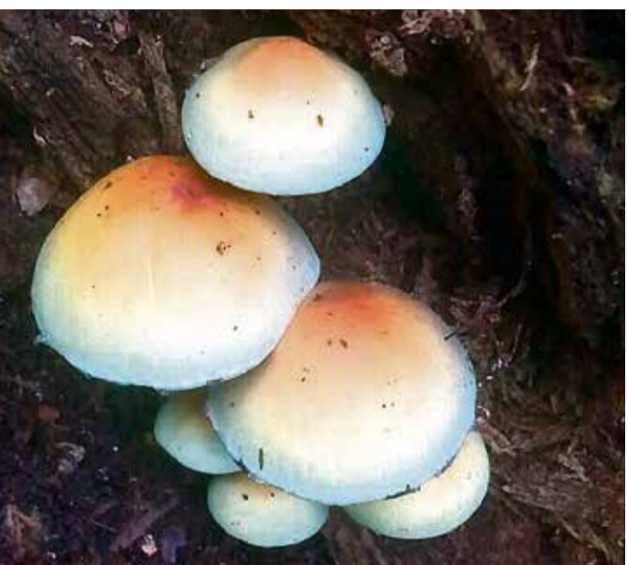
Essbar oder nicht? Im Zweifelsfall sollte man den Pilz lieber stehen lassen oder einen Experten fragen.

Odenwaldkreis. Naturbeobachter können Pilze in der Region entdecken und bei Observation.org melden. Die Beobachtungen fließen in den »Bioblitz 2024« ein, bei dem Naturbegeisterte in ihren jeweiligen Kreisen und kreisfreien Städten in ganz Deutschland versuchen sollen, so viele Tiere, Pflanzen oder Pilze wie möglich zu entdecken. Durch die automatische Foto-Bestimmungsfunktion der App kann jeder auch ohne Artenkenntnis teilnehmen. Die App Obsidentify sollte allerdings niemals dazu verwendet werden, um abzuklären, ob ein Pilz essbar oder giftig ist oder um Pilze zum Verzehr zu suchen. Informationen zu dem Projekt »Bioblitz 2024« auf der Website: www.bioblitz.lwl.org.