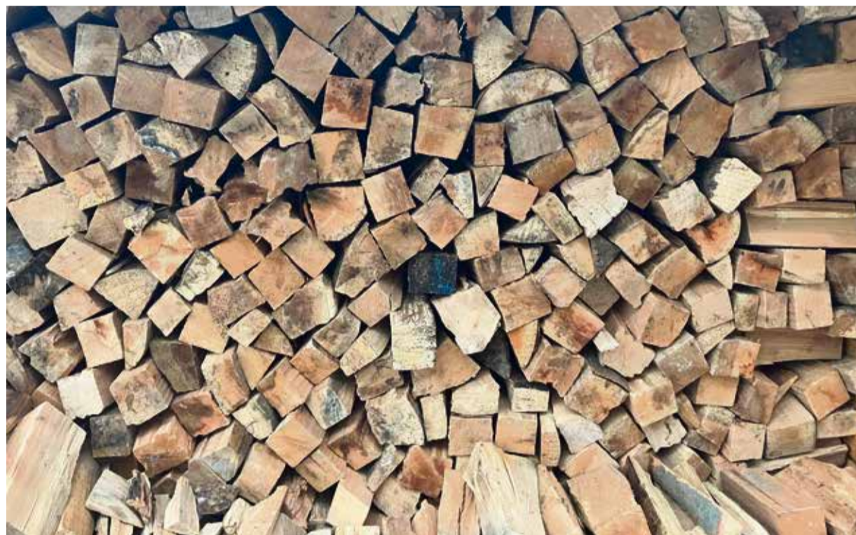
Ein gut gefülltes Lager an Brennholz kann viele gemütliche Abende am Kamin verheißeln.

Odenwaldkreis. Zu Beginn der kälteren Jahreszeit steht es wieder hoch im Kurs: Das Heizen mit Brennholz. Die Saison für das von vielen als behaglich empfundene Heizen mit Kamin hat begonnen, viele stocken ihre Vorräte auf. Wie ist die Lage im Odenwaldkreis?