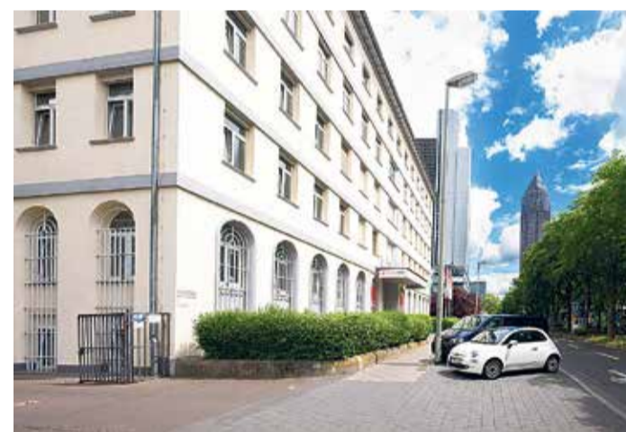
Außenansicht auf das Experiminta ScienceCenter