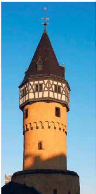
Die Bockenheimer Warte.

Die Bockenheimer Warte, ein mittelalterlicher Wehrturm aus dem 15. Jahrhundert, ist das Wahrzeichen Bockenheims. Ursprünglich Teil der Frankfurter Landwehr, diente sie als Zollstation und Verteidigungsanlage. Heute beherbergt der Turm ein beliebtes Café und