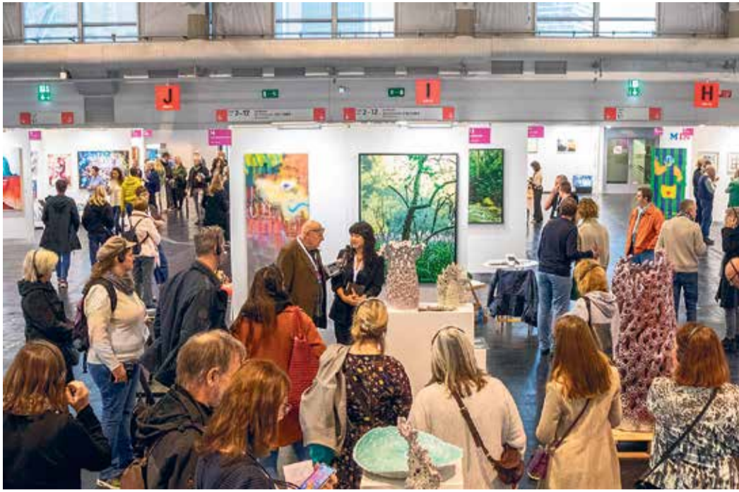
Messeimpression der Discovery Art Fair Frankfurt.