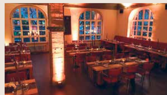
Die gemütliche Atmosphäre des Restaurants im Orfeo's Erben.

Kulturbegeisterte und Genießer finden im Orfeo's Erben in Frankfurt-Bockenheim eine einzigartige Kombination aus Kino, Restaurant und Bar. Diese außergewöhnliche Location bietet Besuchern ein vielseitiges Erlebnis in einem stilvollen Ambiente. Das State-of-the-Art Kino mit Wohnzimmeratmosphäre zeigt ausgewählte Filme, während das Restaurant gehobene Gastronomie serviert. Gäste können einen Abend mit einem exquisiten Dinner beginnen und anschließend einen Film genießen oder umgekehrt. Die Bar lädt zum Verweilen und Diskutieren über das Gesehene ein. Orfeo's Erben ist nicht nur für Privatpersonen attraktiv, sondern eignet sich auch hervorragend für Firmenevents oder Seminare. Besucher sollten vorab die Verfügbarkeit prüfen und reservieren, da die Location oft ausgebucht ist.