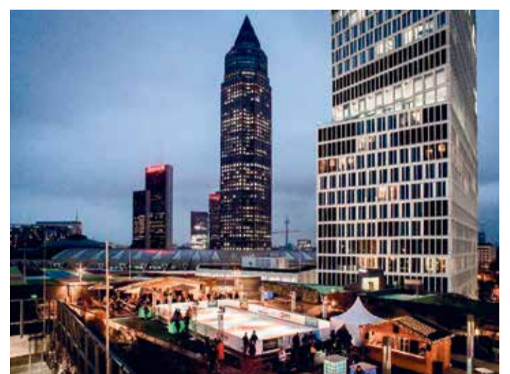
Eisbahn Skyline Plaza 2022.

Eiskönigin Elsa, Eisprinzessin Anna sowie Schneemann Olaf sind ebenfalls mit von der Partie und werden die Eisbahn gebührend einweihen, nebst der Jugendmannschaft der Frankfurter Eishockey Löwen. Center Ma-