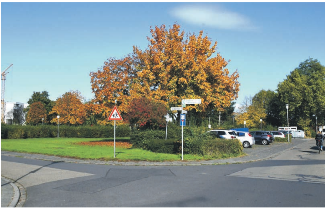
Der nördliche Teil der Straße Im Böhmann (l. im Bild) kommt im Münsterer Staukanal-Projekt südwestlich des Bürgerparks (hinter der Hecke im Bildhintergrund) 2025 als Erstes an die Reihe.

Für die ersten beiden Bauabschnitte hat die Gemeinde das Geld bereits in ihr Investitionsprogramm eingestellt - zumindest für den Staukanal. Der schlägt in dieser Phase mit