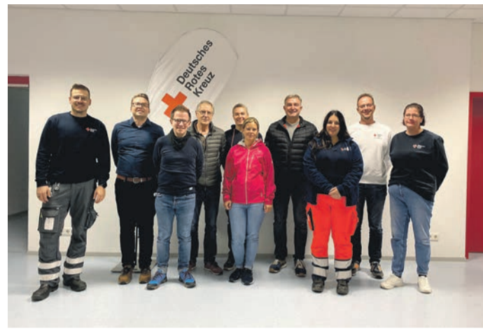
Mitglieder von DRK Münster und FDP Münster und Altheim in der DRK-Ortswache am Abtenauer Platz.

schafft wurde (bei Finanzierung über Spenden und Mitgliedsbeiträge). Ein Fahrzeug wird seitens des Landkreises als Katastrophenschutzfahrzeug bereitgestellt und finanziert und kam unter anderem beim großen Waldbrand in der Muna zum Einsatz. Wie dies auch für viele andere Vereine gilt, so lebt auch das DRK von seinen Ehrenamtlichen und muss dabei um das knapper werdende Zeitbudget von potenziell Interessierten kämpfen, denen mit der Möglichkeit der Ausbildung zum Rettungssanitäter viel geboten wird: Über den Landesverband kann diese Ausbildung absolviert werden, was letzten Endes wieder Münsters Bürgerinnen und Bürgern im Bedarfsfall zugutekommt! Interessierte, die vor Ort in Münster mithelfen möchten sollten mindestens 18 Jahre alt sein und werden mit einer 48-stündigen „Grundausbildung“ für den Einsatz beim DRK fit gemacht. Neben Voraus-Helfer-Einsätzen führt der Münsterer DRK-Ortsverein auch für die medizinische Grundversorgung wichtige Blutspendetermine durch und leistet Sanitätsdienst bei