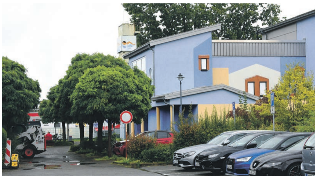
Seit Sommer 2019 ist das Münsterer Hallenbad geschlossen und soll abgerissen werden. Eventuell könnte auf dem Grundstück ein Wohngebiet samt kleinem Bad entstehen, Nun gibt es dazu zwei neue Vorstöße.