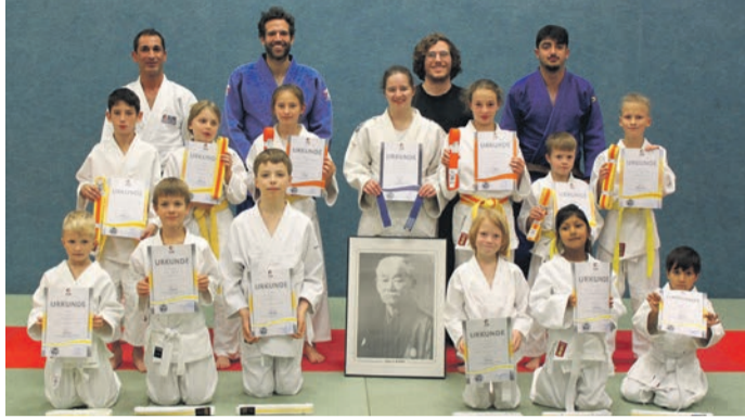
Die Judoka des KSV freuen sich über die bestandenen Gürtelprüfungen.

In den vergangenen Jahren fanden die Gürtelprüfungen mit Ausnahme der höheren Graduierungen, immer im Rahmen des Trainings statt. Dabei wurden alle erforderlichen Techniken im Training gezeigt und bei entsprechender Beherrschung der nächsthöheren Gürtelgrad verliehen. Die Anerkennung durch die