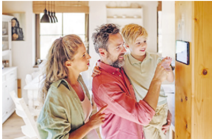
Komfortable, umweltfreundliche und bezahlbare Wärme wünschen sich alle Hauseigentümer. Welche Technik am besten zum Haus passt, wissen die Meister der Elemente.

Welche Heizlösung für das eigene Zuhause die richtige ist, hängt von vielen Faktoren ab: Der Bausubstanz, den energetischen Gegebenheiten des Hauses und den