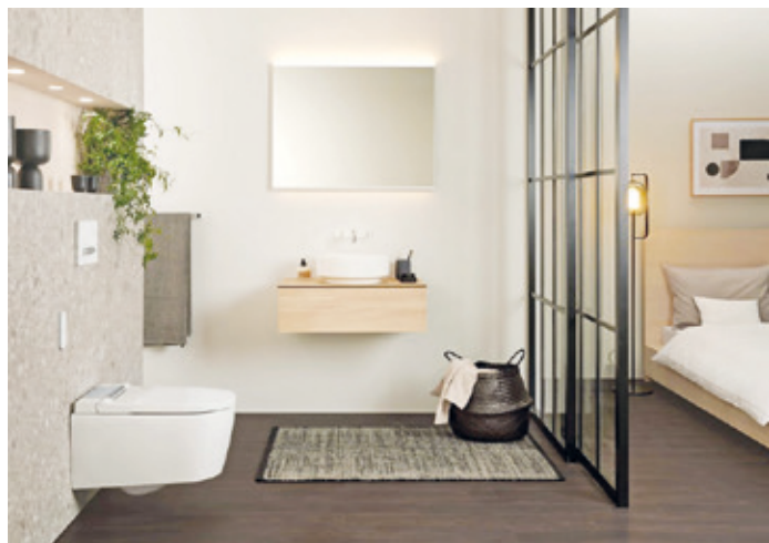
Das Bad als Lebensraum und Ort der Begegnung: Offene Wohnkonzepte, die sich in der Küche bereits durchgesetzt haben, könnten auch in die Badgestaltung Einzug halten.

Für Christoph Behling liegt das Geheimnis eines gelungenen Badezimmers in der perfekten Balance zwischen Ästhetik und Funktion. Das Bad ist schon lange nicht mehr die rein funktionelle Nasszelle, sondern ein wichtiger Lebensraum und ein Ort der Begegnung. Behling vergleicht dies mit