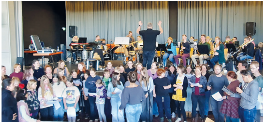
Just AmaSing und Soundproof zusammen mit der One Night Band während der Probe am 03.11. im Bürgerhaus.

Die Gäste erwartet ein abwechslungsreiches Programm unserer drei Chöre