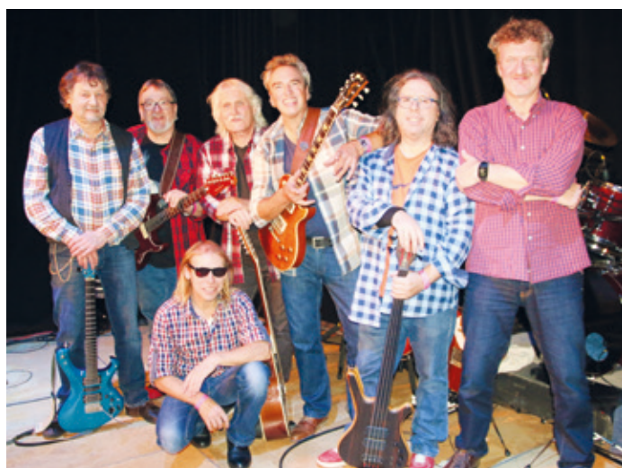
jeden Song authentisch und detailverliebt im Spirit ihrer Vorbilder. Fünf Stimmen, jede Menge Akustik- & E-Gitarren, Bass, Saxofone, Keyboards – und dazu ein Lead-Vocals

Die Band „EAGLES RELOADED“ hat sich über viele Jahre eindrucksvoll als feste Größe in Deutschlands Tribute-Landschaft etabliert. Das Repertoire dieser siebenköpfigen Formation umfasst die legendären, aber auch neueren Songs der kalifornischen Supergroup EAGLES. Vom ersten Erfolg Take It Easy, dem Grammy-Hit How Long, vom Meilenstein Hotel California bis hin zum A-Cappella-Klassiker Seven Bridges Road präsentiert EAGLES RELOADED