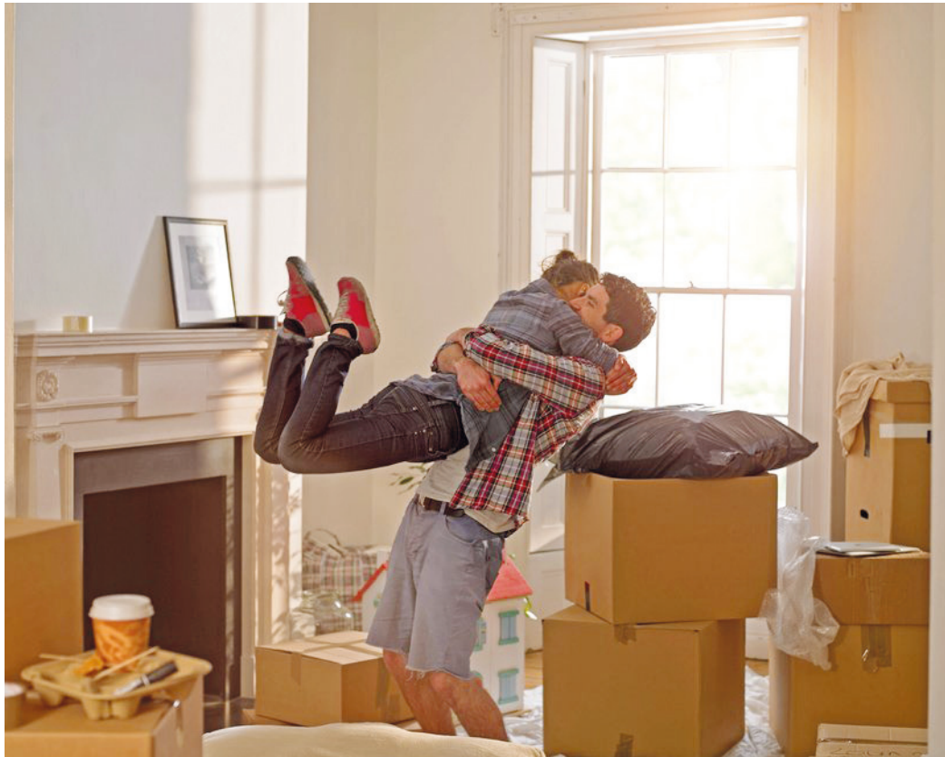
Vorfreude pur: Nach dem Umzug beginnt ein neuer Lebensabschnitt. Damit man sich so glücklich in die Arme fallen kann, ist allerdings vorher viel Planung und Organisation nötig.

Die kompakte zeitliche Checkliste, damit alles reibungslos verläuft