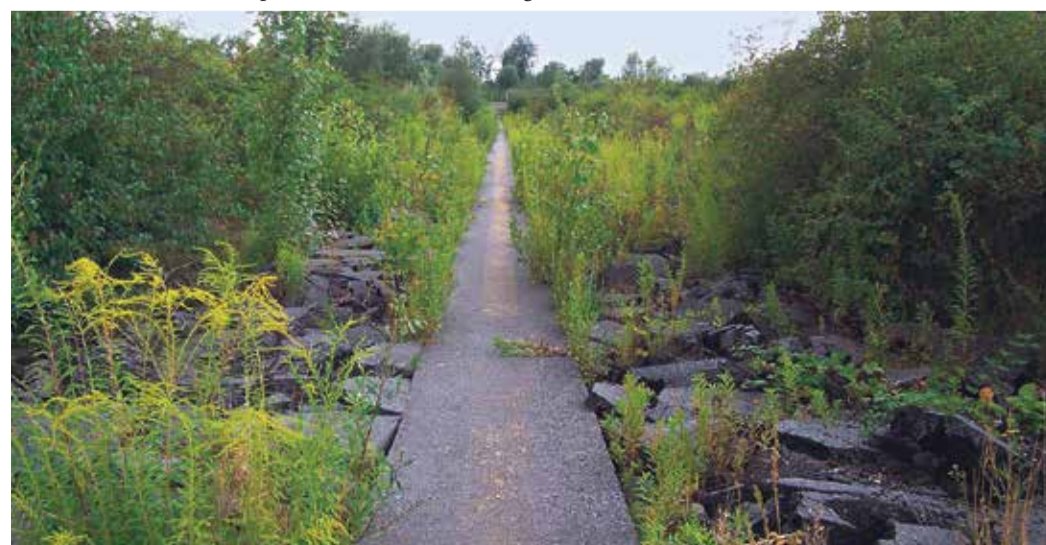
Renaturierung der ehemaligen Landebahn am Flugplatz Bonames

Der Park, malerisch in einer Niddaschleife gelegen, ist ein Paradebeispiel für die gelungene Verbindung von Naherholung und Naturschutz. Entstanden aus einem ehemaligen Nidda-Altarm, bietet der Park auf 7 Hektar eine Vielfalt an Möglichkeiten: Von Grillplätzen über Sportflächen bis hin zu naturbelassenen Wildnisbereichen ist für jeden etwas dabei. Ein Highlight ist die Sondermann-Figur, ein humorvolles Kunstobjekt am Grüngürtel-Rundwanderweg. Der Park ist Teil des Projekts "Städte wagen Wildnis", das die natürliche Entwicklung von Stadtnatur fördert. Besucher können hier beobachten, wie sich Flora und Fauna in einem urbanen Umfeld entfalten. Mit seinen verschlungenen Pfaden und versteckten Winkeln lädt der Nordpark zu