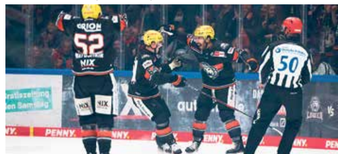
Die Löwen jubeln über ihren Treffer gegen Red Bull München.

klein. Nach unten haben die Löwen sich sogar ein kleines Polster geschaffen, das nach der Pause weiter ausgebaut werden soll. Am Donnerstag, 14. November, um 19:30 Uhr, kommt der Tabellenvorletzte – die Iserlohn Roosters – in die NIX Eissporthalle am Ratsweg. Gegen die Sauerländer konnten die Löwen vor einem Monat bereits bei ihrem Gastspiel in Iserlohn mit 4:3 gewinnen. Ein erneuter Sieg würde den Löwen weitere Luft nach unten verschaffen. Karten für dieses und alle anderen Heimspiele gibt es im Löwen-Ticket-Shop: www.loewen-frankfurt.de/tickets