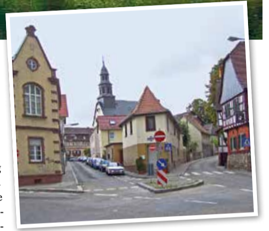
Homburger Landstraße in Bonames

Die Nidda, die Bonames im Westen begrenzt, ist nicht nur ein wichtiger ökologischer Lebensraum, sondern auch ein beliebtes Naherholungsgebiet. Der Niddauerweg, der entlang des Flusses verläuft, ist Teil des Frankfurter Grüngürtels und verbindet Bonames mit den umliegenden Stadtteilen. Radfahrer, Jogger und Spaziergänger schätzen den Weg für seine naturnahe Atmosphäre und die abwechslungsreiche Landschaft. Besonders reizvoll ist der renaturierte Altarm der Nidda, der 2009 wieder an den Hauptfluss angeschlossen wurde. Hier können Besucher die vielfältige Flora und Fauna beobachten, darunter zahlreiche Vogelarten und Amphibien. Der Niddauerweg bietet nicht nur Erholung, sondern auch einen Einblick in die ökologischen Bemühungen der Stadt Frankfurt, urbane Räume naturnah zu gestalten und zu erhalten.