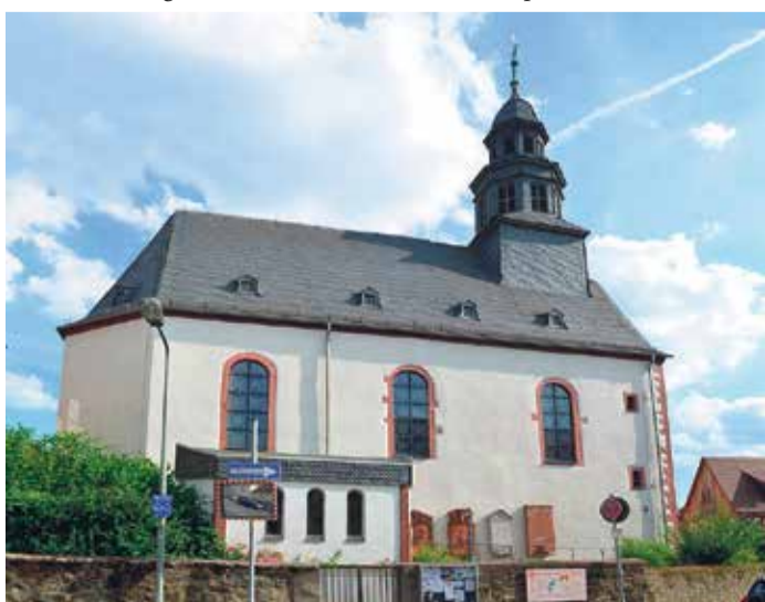
Nordsicht der Kirche

Die Burg Bonames, vermutlich im 13. Jahrhundert errichtet, ist ein faszinierendes Zeugnis mittelalterlicher Architektur. Obwohl sie 1546 im Krieg niedergebrannt und zur Ruine wurde, erzählen ihre Überreste noch heute von der bewegten Geschichte des Ortes. Archäologische Untersuchungen in den 1980er und 1990er Jahren brachten wertvolle Erkenntnisse über die Anlage zutage. Heute können Besucher anhand von Informationstafeln und roten Pflastersteinen, die den Grundriss markieren, die einstige Pracht der Burg erahnen. Ein Spaziergang durch die Ruinen lädt dazu ein, in die Vergangenheit einzutauchen und sich vorzustellen, wie das Leben in einer mittelalterlichen Burg ausgesehen haben mag.