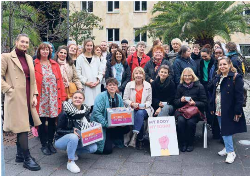
Protestaktion „Feministische Mahlzeit“.