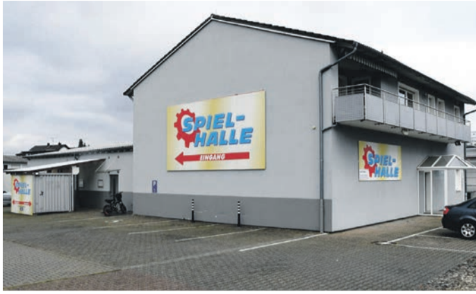
Von den Eppertshäuser Spielotheken - hier die „Spielhalle“ in der Oberwaldstraße - erhält die Gemeinde in diesem Jahr voraussichtlich weniger Spielapparatesteuer als kalkuliert. Bei der Gewerbesteuer liegt sie hingegen über dem Plan.

Gemeinde kann ihr kalkuliertes Defizit 2024 wohl halbieren - auch wegen mehr Gewerbesteuer