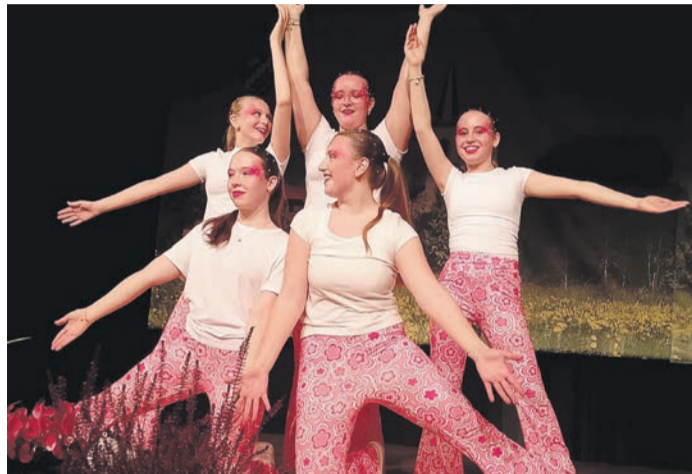
Der Odenwälder Abend wartet stets mit vielen bezaubernden Kostümen auf. Das war diesmal, wie hier bei den Tanzgruppen, nicht anders. Der 70er-Jahre-Stil ließ viel Gestaltungsfreiheit zu.

Die Veranstaltung des über 500 Mitglieder zählenden Vereins wird auch als Familienabend bezeichnet, da von Klein bis Groß alle dabei sind und sämtliche Sparten einen Abriss ihres Könnens liefern. Dazu zählen die verschiedenen Tanzgruppen, wie die Tanzmäuse, die Flinken Flitzer oder Auxilium, ebenso wie das Mandolinenorchester,