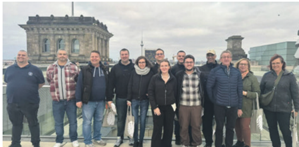
Highlights und Gesprächsmög-