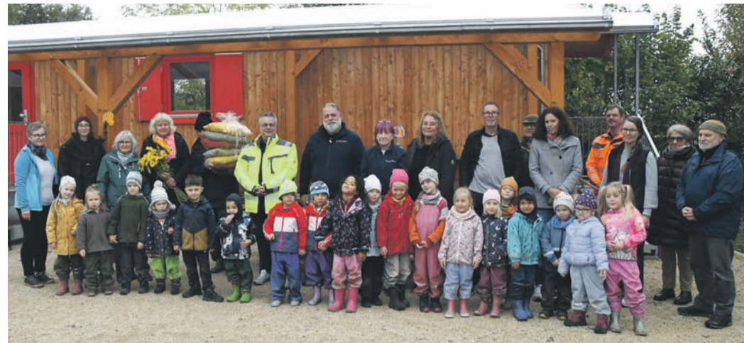
Die neue Münsterer „Naturkita“ bei den Schützen wurde am Dienstag im Beisein von Vertretern der Gemeinde, Erzieherinnen, Eltern und natürlich den Kids offiziell eröffnet. Das Foto entstand vor dem neuen Holz-Bauwagen.

Der Wagen ist kindersicher ausgeführt, wird per Gasofen (mit Gitter geschützt) beheizt und über eine Photovoltaik-Anlage auf seinem Dach mit Strom versorgt. Außerdem gibt es drinnen eine Küchenzeile. Die Sanitäreinrichtungen befinden sich in einem separaten Container. Das Essen bringt ein Caterer aus Rödermark. Eingeonnen werden kann es auch regen- und sonnengeschützt auf der überdachten Veranda vor dem Container.