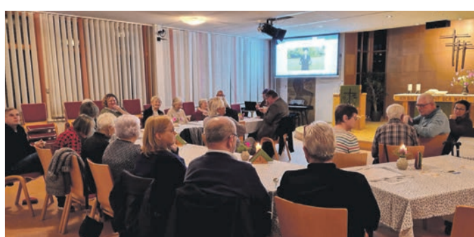
Volles Haus zum Reformationstag – die Gäste erleben einen besonderen Abend.