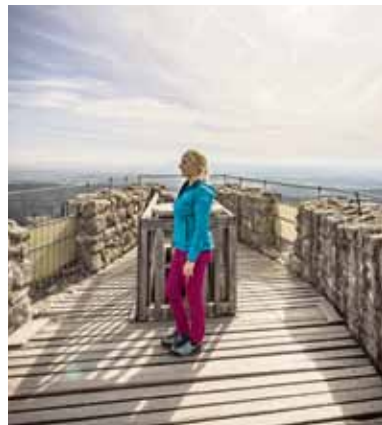
Der Oberpfälzer Wald lockt mit weiten Ausblicken, stiller Natur und kulturellen Kleinoden.

Auf dem „Grünen Dach Europas“ verschmelzen Naturerlebnis und Kulturgenuss auf besonders spannende und gleichzeitig sehr entspannte Art und Weise. Nicht nur Goldsteig und Nurtschweg, zwei der