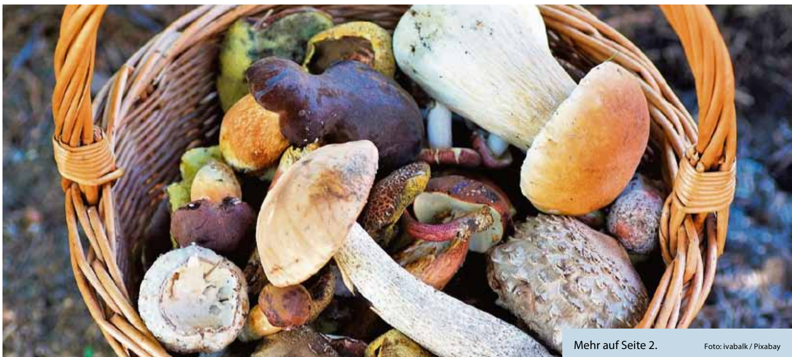
Mehr auf Seite 2.