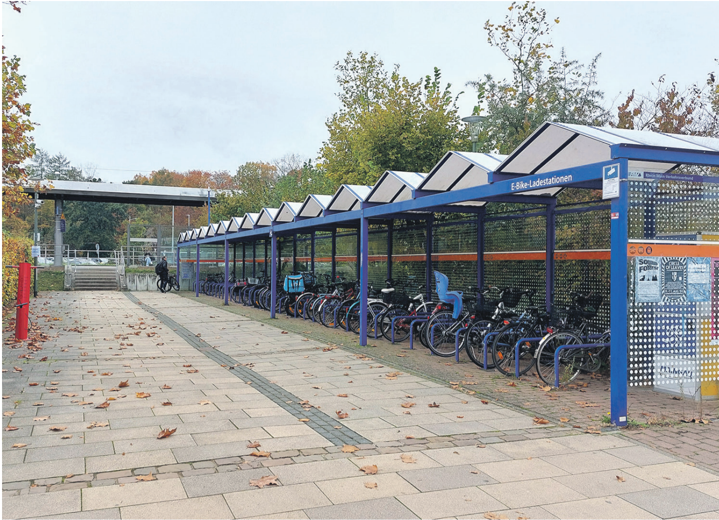
Die Bike+Ride-Anlage am Heusenstammer Bahnhof.