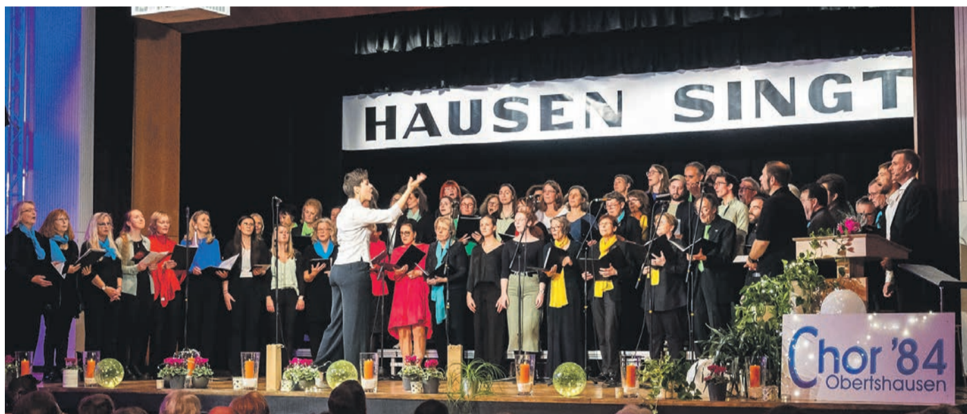
Beim Finale standen alle drei Chöre auf der Bühne.