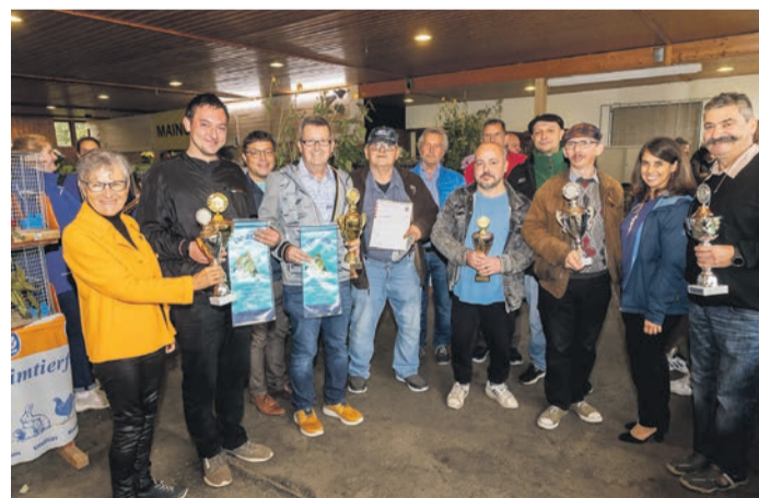
Trotz einiger Einschränkungen konnte sich das Zuchtergebnis wieder sehen lassen.

Obertshausen (ah) Es dürfte nicht allzu oft vorkommen, dass eine Geflügel- und Taubenschau mit Musik eröffnet wurde. Dieses seltene Erlebnis bot der Vogel- und Geflügelzuchtverein Obertshausen, bei der offiziellen Eröffnung der 16. Stadtschau des Vogel- und Geflügelzuchtvereins (VGZV) Obertshausen und des RGZV 1937 Hausen e.V auf dem Gelände am Rembrücker Weg.