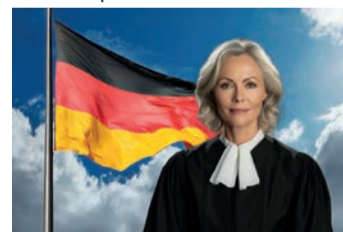
Es geht um viel Geld

Ob Ihr Vertrag betroffen ist, prüft zum Beispiel das Düsseldorfer Ver-