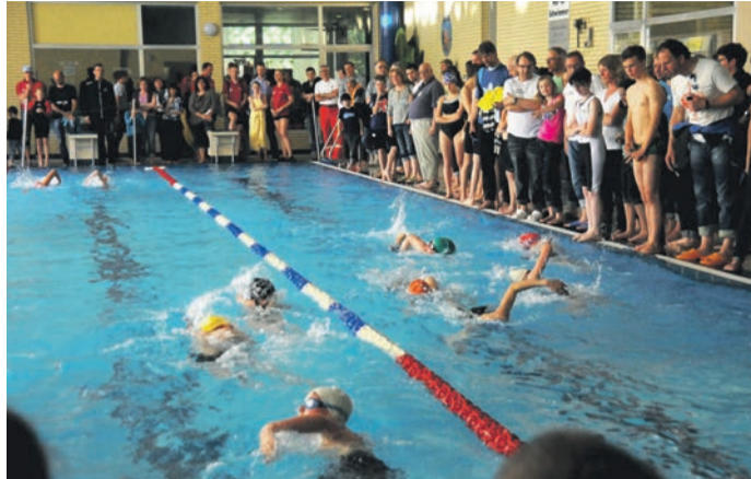
Das waren noch Zeiten: ein Foto vom Schülertriathlon, den der VfL Münster jahrelang auch im Schwimmerbecken des Hallenbads durchführte. Sportlich ambitionierte Schwimmer zählen in der Anbahnung eines neuen Bads nicht zu den Zielgruppen des Bürgermeisters.

sions-Show wird am Dienstag, 19. November, von 19.30 Uhr an in den „Kaisersaal Lichtspielen“ (Darmstädter Strasse 23) in Münster präsentiert werden. Ticketreservierung unter: info@kanadareisen.de oder Tel. 66620. Reservierte Karten: 10 Euro / Abendkasse: 12 Euro.