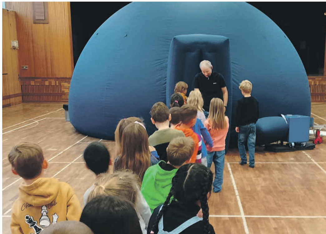
Wenn ein Planetarium an die Schule kommt, könnte es sich um das Lernarium vom Otzberg handeln. Die mobile Mini-Version schlug nun an der Stephan-Gruber-Schule in Eppertshausen auf und schickte die Schüler ins Planetensystem.

Unter anderem wurden die acht Planeten unseres Sonnensystems vorgestellt. „Merkur ist der Sonne am nächsten. Auf ihm könntet ihr euren Geburtstag theoretisch alle 88 Tage feiern, denn so lange dauert es, bis er die Sonne umkreist hat“, erfuhren die Kinder. Der größte Planet heißt Jupiter,