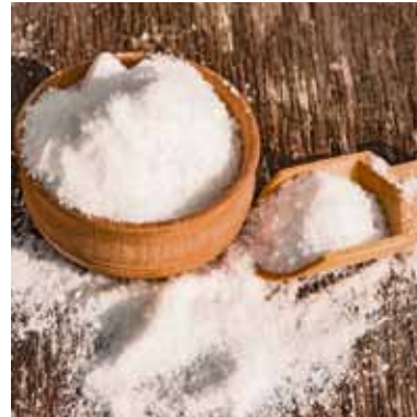
Lange Zeit wurde Salz auch als das „weiße Gold“ bezeichnet. Im Mittelalter war es rar und sehr wertvoll.

Der Salzbedarf im Mittelalter war entsprechend groß. Heringe aus der Ostsee wurden beispielsweise auf See direkt ausgenommen und gepökelt. Diese gesalzene Fische wurden dann von der Küste ins Inland transportiert und waren ein wichtiger Bestandteil des Speiseplans, vor allem an den Fastentagen. „Für das Einlegen von Heringen war im Mittelalter das Lüneburger Salz besonders wichtig“, sagt Dr. Hentschel. Der Salzhandel bestimmte bereits im 12. Jahrhundert das Leben in der norddeutschen Stadt. Die örtliche Saline erlaubte eine Salzgewinnung in großem Maßstab. Überhaupt haben Salzproduktion und Salzhandel in Deutschland ihre Spuren hinterlassen. Unter www.vks-kalisalz.de erfährt man mehr zum Salzabbau in Deutschland. Viele Städte und Orte tragen das Wort Salz, das altdeutsche Sulz oder das keltische „Hall“ noch im Namen, etwa Salzgitter, Sulzbach oder Bad