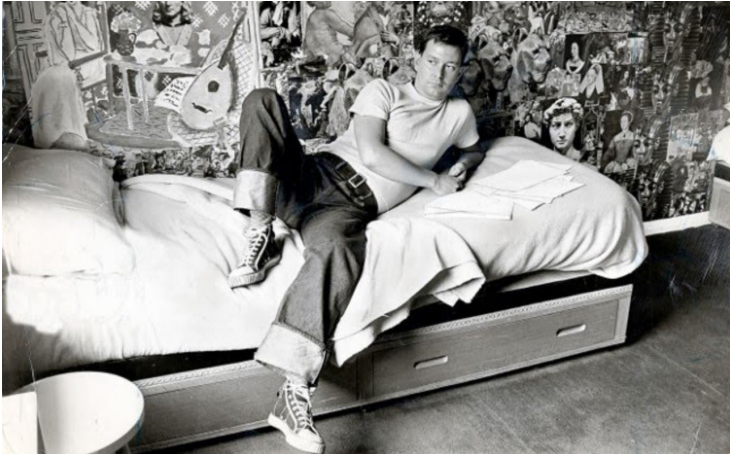
Joe Orton at 25 Noel Road, London, 16 April 1964. https://designobserver.com/joe-orton-dangerous-collage/ [zuletzt aufgerufen am 08.10.2024]

In What the Butler saw gerät ein scheinbar erfolgreicher Psychiater in eine brenzlige Situation, als seine Frau ihn fast dabei erwischt, wie er versucht, eine Bewerberin für den Sekretärinnenposten zu verführen. Die Lage wird noch komplizierter, als seine Frau einen Erpresser nach Hause bringt, der sich ebenfalls auf den Sekretärinnenposten bewirbt. Das Chaos eskaliert weiter, als ein Regierungsbeamter unangekündigt zu einer Inspektion erscheint und der Arzt und seine Frau verzweifelt versuchen, ihre Fehler zu vertuschen. Die Absurdität erreicht ihren Höhepunkt, als ein Polizist auftaucht, der nach der Bewerberin sucht, während der Erpresser denkt, der Polizist sei hinter ihm her. Was folgt, ist ein wahres Tollhaus an Peinlichkeiten, bis am Ende doch alles gut ausgeht - augenscheinlich.