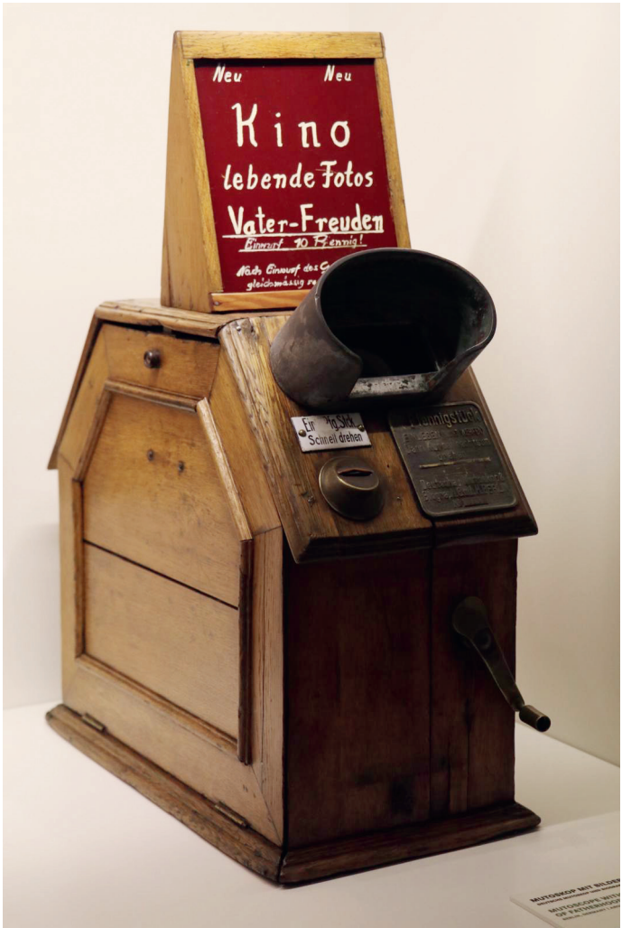
Mutoskop – Filmmuseum Frankfurt